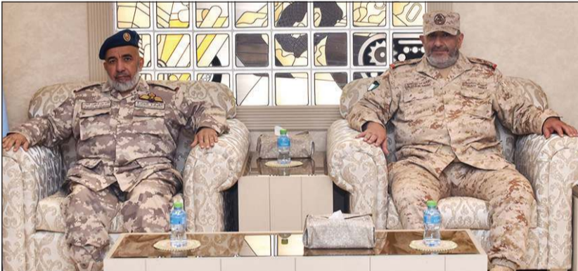
الفريق الركن خالد صالح الصباح مستقبلاً رئيس أركان القوات القطرية الفريق الركن طيار غانم الغانم

العلاقات الثنائية بين البلدين. من جانب آخر، أعلن الجيش إقلاع طائرة تابعة للقوة الجوية الكويتية متوجهة إلى جمهورية تونس الشقيقة ضمن الجسر الجوي الذي خصص لنقل وشحن 20 طناً من الأكسجين. وقالت مديرية التوجيه المعنوي والعلاقات العامة بالجيش الكويتي في بيان صحفي إن هذه الرحلة التي تأتي بالتعاون والتنسيق مع وزارة الخارجية تعتبر الثالثة ضمن الجسر الجوي.