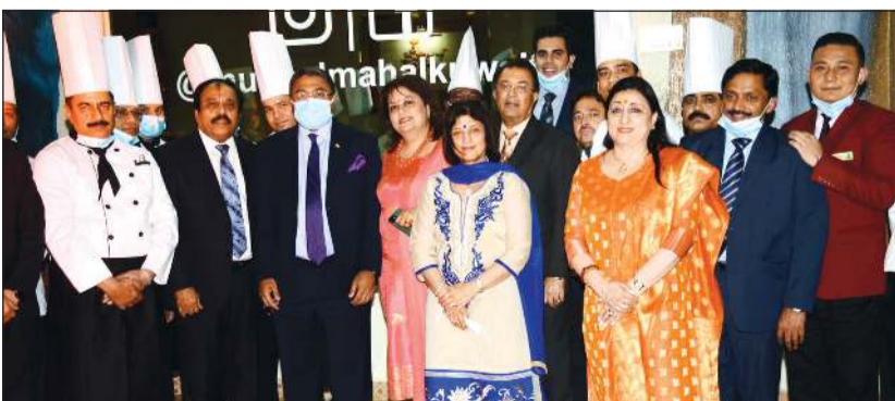
السفير الهندي مع عدد من الحضور

العلاقات الدبلوماسية مع الكويت، بالإضافة إلى أنه يشهد احتفال الكويت بالذكرى الـ 60 لاستقلال الكويت، موضحة أن السفارة أعدت سلسلة من الفعاليات للاحتفال بهذه المناسبات الثلاث. ولفت جورج إلى أن السفارة وضعت خطة تشمل إقامة 750 فعالية للاحتفال بالمناسبات الثلاث، مشدداً على أن الخطة تشمل الالتزام التام بالتعليمات والإشراف التي حددتها السلطات الصحية في الكويت فيما يخص الوقاية من جائحة كورونا.