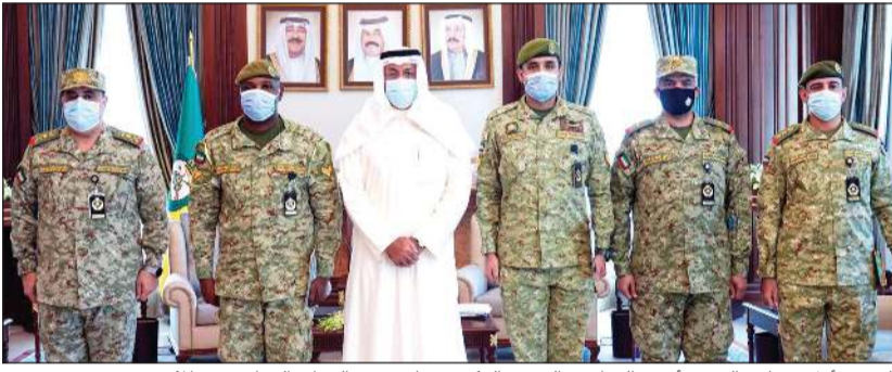
الفريق أول متقاعد الشيخ أحمد النواف والفريق الركن م. هاشم عبدالرزاق الرفاعي مع المكرمين

اندلع بأحد المحلات التجارية قرب الفندق الذي يشاركان في تأميمه. وأشاد الفريق أول متقاعد الشيخ أحمد النواف، نائب رئيس الحرس الوطني، بما قام به المكرمان وتقديمهما نموذجاً مشرفاً لرجال الحرس الوطني، مما يعكس إخلاصهما وتفانيهما في خدمة الوطن، مشيراً إلى أن تكريم المتميزين هو نهج القيادة في الحرس الوطني منذ إنطلاقته مسيرته لإعلاء قيم الولاء والانتماء وتعزيز روح المبادرة والإبداع لدى المنتسبين.