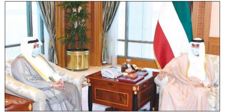
صاحب السمو خلال استقباله الشيخ حمد جابر العلي

سموه خالص تعازيه وصادق مواساته بضحيا انفجار صهرج وقود في بلدة (تليل) شمالي لبنان والذي أسفر عن سقوط العشرات من الضحايا والمصابين، راجيا سموه للضحايا الرحمة وللمصابين سرعة الشفاء والعافية. كما بعث سمو رئيس مجلس الوزراء الشيخ صباح الخالد ببرقية تعزية مماثلة. من جانب آخر، بعث صاحب السمو الأمير الشيخ نواف الأحمد ببرقية تهنئة إلى الرئيس رام ناث كوفيند رئيس جمهورية الهند الصديقة عبر فيها سموه عن خالص تهانيه بمناسبة ذكرى استقلال بلاده، متمنيا سموه له موفور الصحة والعافية والازدهار. وبعث سمو ولي العهد الشيخ مشعل الأحمد ببرقية تهنئة إلى الرئيس رام ناث كوفيند رئيس جمهورية الهند الصديقة، ضمنها سموه خالص تهانيه بمناسبة ذكرى استقلال بلاده، متمنيا سموه له موفور الصحة والعافية.