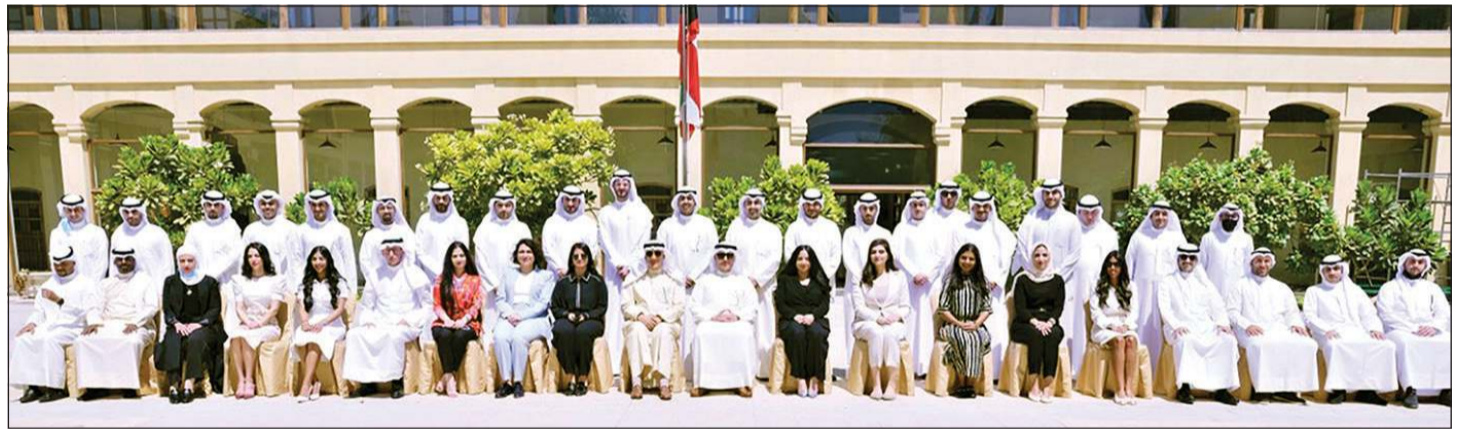
وزير الخارجية الشيخ د. أحمد ناصر المحمد يتوسط منتسبي الدفعة السابعة الذين يتلقون تدريبهم في المعهد

على مبادئ الأتزان والاعتدال والتعاون وتعزيز ركائز الأمن والسلام في العالم وخدمة العمل الإنساني. وزير الخارجية ووزير الدولة لشؤون مجلس الوزراء الشيخ د. أحمد ناصر المحمد اتصالاً هاتفياً بوزير خارجية تركيا مولود جاويش أوغلو للتعزية بضحيا الفيضانات التي شهدتها بلاده. ونقل الشيخ د. أحمد ناصر خلال الاتصال خالص تعازي وصادق مواساة