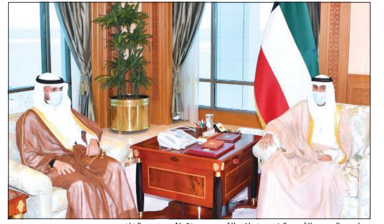
صاحب السمو الأمير الشيخ نواف الأحمد مستقبلاً مرزوق الغانم