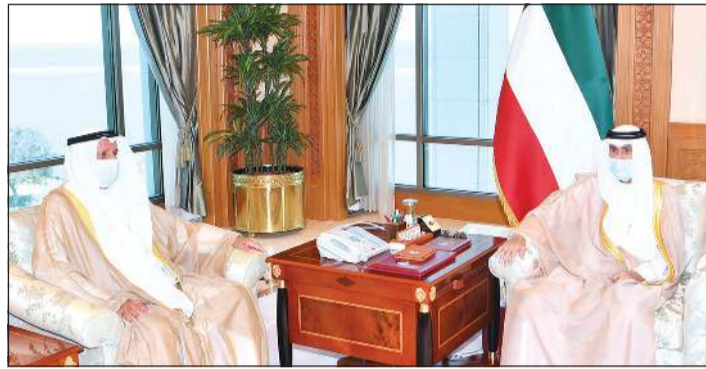
صاحب السمو مستقبلاً عبدالله الرومي