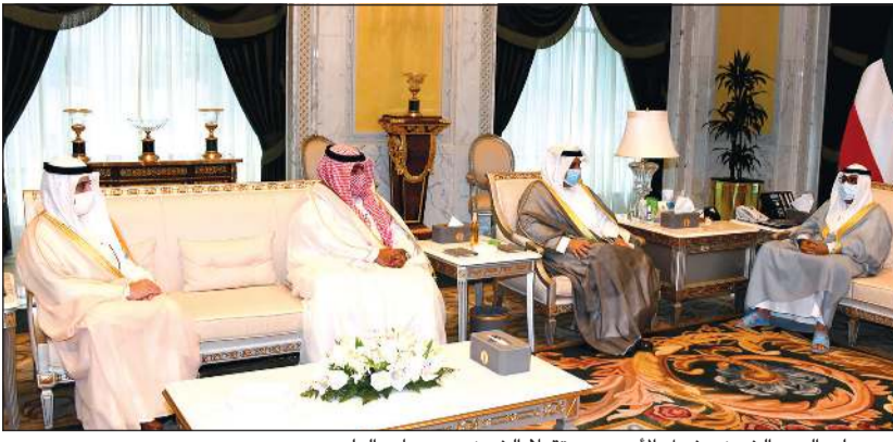
سمو ولي العهد الشيخ مشعل الأحمد مستقبلاً الشيخ حمد جابر العلي والشيخ تامر العلي والشيخ د. أحمد ناصر المحمد