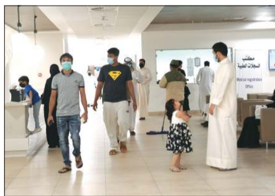
المستشفى الجديد يحقق طفرة نوعية في تقديم الخدمات الطبية على مستوى الكويت

الخروج داخل المستشفى وضبط عملية الزيارة داخل المستشفى. ما مدى صحة ما يتردد من أن العلاج بالمستشفى للكويديين فقط؟ ● لدينا أماكن في المستشفى مخصصة بأن تكون وحدات لعلاج الأورام في المستشفى الجديد، ولدينا خطط لافتتاح أماكن لمعالجة أمراض السرطان في مستشفى الجهراء لتخفيف الضغط عن مركز الكويت للسرطان.