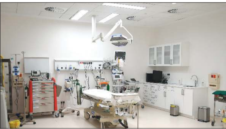
المستشفى مزود بأحدث الأجهزة الطبية

مستشفى الجهراء الجديد يتكون من 4 أبراج تضم 1235 سريراً و180 عيادة و36 جناح عمليات و156 سريراً للعناية المركزة