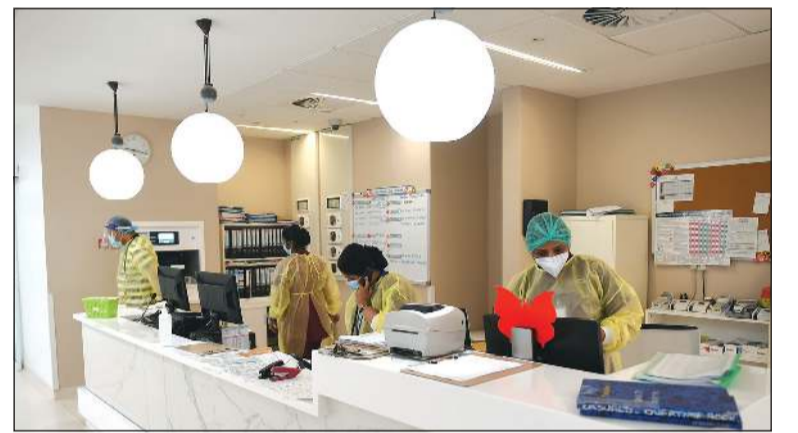
تطبيق أعلى معايير الجودة

تخصصات جديدة قريبا منها جراحة القفص الصدري والتجميل وعلاج الخصوبة والعقم لدى الرجال سيتم افتتاح عيادات جديدة في تخصص الأنف والأذن والحنجرة مع التوسع في العيادات غير الطارئة استعنا بالقوات الخاصة لتنظيم عملية الدخول والخروج داخل المستشفى وضبط عملية الزيارة