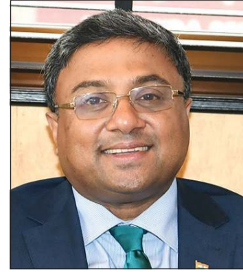
السفير الهندي سيبى جورج

للأمن البحري في منطقتنا على أساس رؤية SAGAR (الأمن والنمو للجمعي في المنطقة). وهذا باختصار يلخص رؤيتنا لهيئة بيئية من السلام والأمن لضمان عالم أفضل للبشرية جمعاء، والتي كانت الروح التوجيهية لسياسة الهند الخارجية. تضع الهند إيمانا ومعقدا راسخين بالنهج متعدد الأطراف، وقد أخذت دائما زمام المبادرة في القضايا ذات الاهتمام العالمي مثل الإرهاب الدولي، وتغير المناخ، وأمن الطاقة، والأمن الغذائي، وإصلاح المؤسسات المتعددة الأطراف، بما في ذلك مجلس الأمن التابع للأمم المتحدة. وأكد السفير الهندي أن منطقة الخليج والشرق الأوسط تحتل مكانة محورية في إطار السياسة الخارجية للهند وتعد دول مجلس التعاون الخليجي واحدة من أكبر التكتلات التجارية لدينا، حيث تلي نسبة كبيرة من متطلبات الطاقة في الهند وتستضيف أكثر من 8 ملايين هندي. كما أن العلاقات الثنائية بين الهند والكويت مستمرة بالتعزيز مع زيادة عدد الزيارات الثنائية من كلا الجانبين، حيث زار وزير الخارجية ووزير الدولة لشؤون مجلس الوزراء الشيخ د.أحمد ناصر المحمد، الهند في مارس الماضي ومن خلال هذه الزيارة رفع بلدانا اللجوء الوزاري المشتركة الحالية إلى مستوى وزراء الخارجية وأعقب ذلك زيارة جياشانكار وزير الشؤون الخارجية الهندي إلى الكويت في يونيو 2021 الماضي.