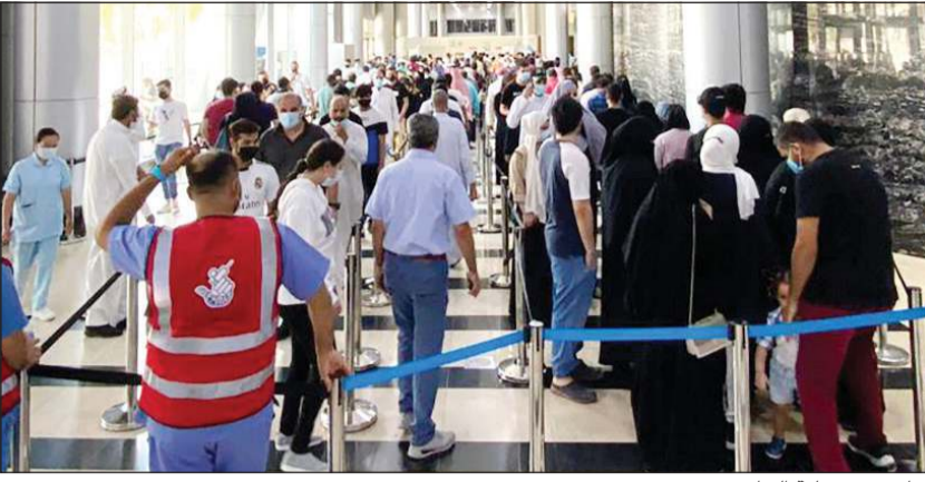
جانب من عملية التطعيم