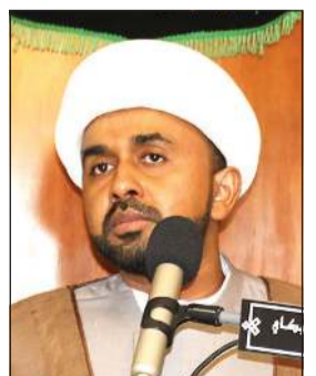
الشيخ أحمد غولوم