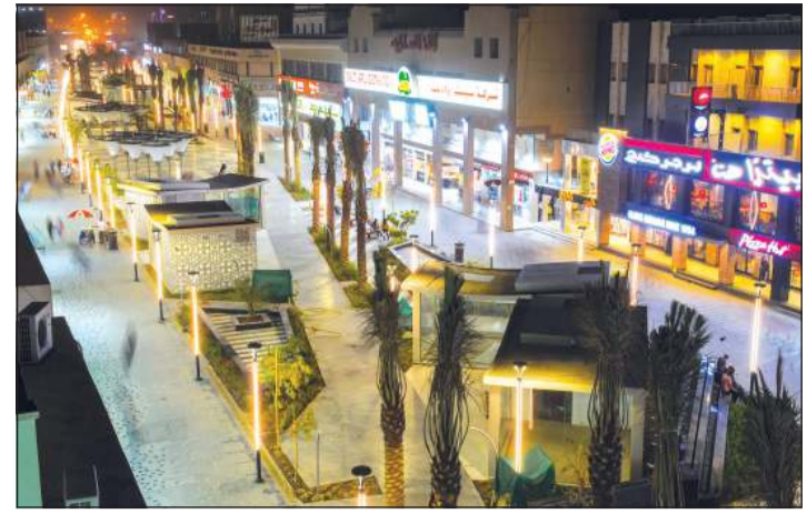
مشروع برايع سالم طرح ونفذ بأفكار شبابية كويتية