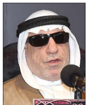
الشيخ حسن القيم