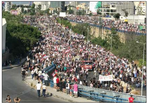
لبنانيون تقاتروا من جميع المناطق للمشاركة في الذكرى