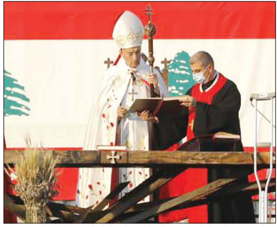
البطريرك بشارة الراعي متحدثا خلال قداس لراحة نفس الشهداء