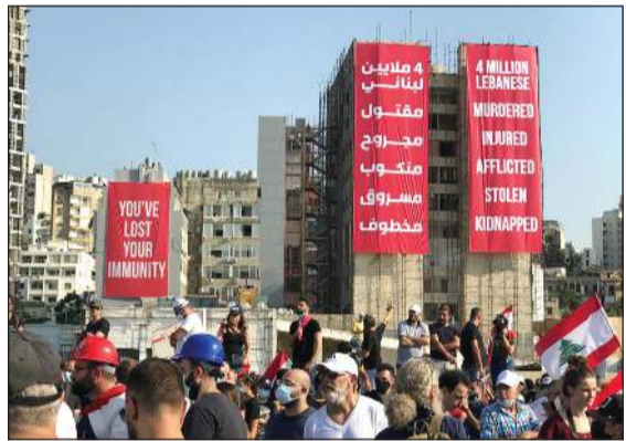
شعارات تضامن مع أهالي ضحايا التفجير