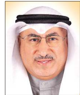
د. محمد الفارس

جامعة الكويت سيتم تنصيبها بعد تعيين مدير الجامعة حسب القانون الجديد للجامعات الحكومية، وفي رده على سؤال حول سبب تمديد لجنة اختيار مدير جامعة الكويت، قال الفارس: سبب تمديد لجنة مدير الجامعة هو يطلب من بعض أعضاء هيئة التدريس لتعارض وقت التقديم السابق مع مواعيد الاختبارات النهائية وعيد الأضحى، وفيما يخص جامعة عبدالله السالم، قال الفارس: نحن بانتظار إصدار مرسوم بأسماء مجلس الإدارة التأسيسي لجامعة عبدالله السالم حسبما ينص قانون الجامعات الجديد.