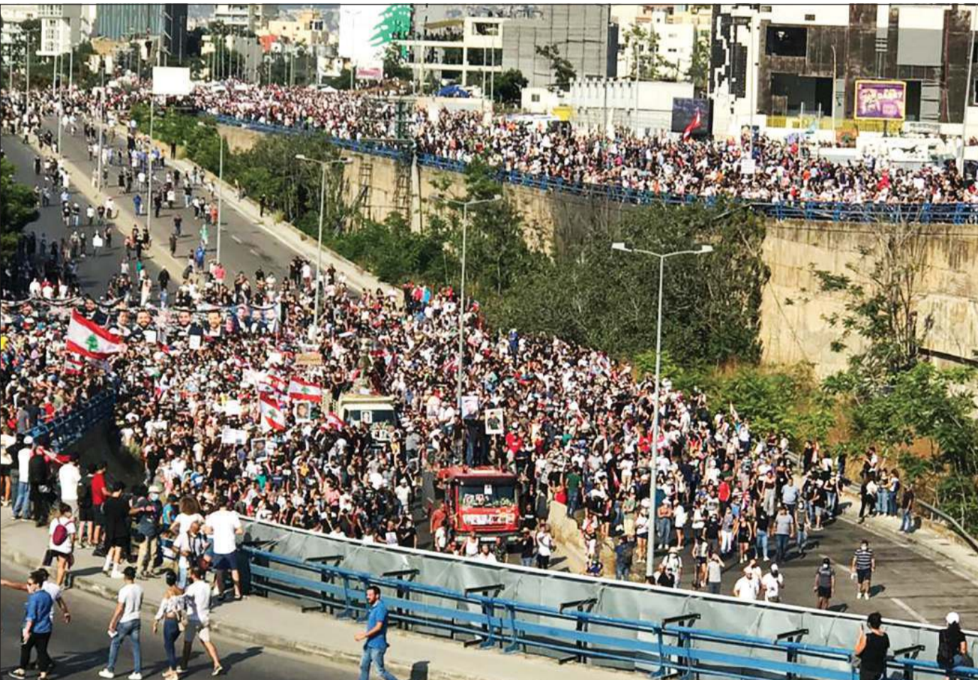
آلاف اللبنانيين يشاركون في إحياء ذكرى انفجار مرفأ بيروت (محمود الطويل)

اللبنانيون في ذكرى انفجار المرفأ: نحن الشعب الخط الأحمر