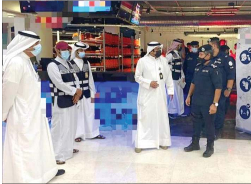
العميد وليد الشهاب وعدد من رجال الأمن والبلدية خلال الحملة

الصحية خاصة فيما يتعلق بدخول المجمعات للمطعمين أسفرت عن تحرير عدة مخالقات. وبحسب مصدر أمني، فإن الحملة نفذت بحضور مساعد مدير عام مديرية أمن الأحمدية العميد وليد الشهاب، مشيراً إلى أنه تم تحرير عدة مخالقات.