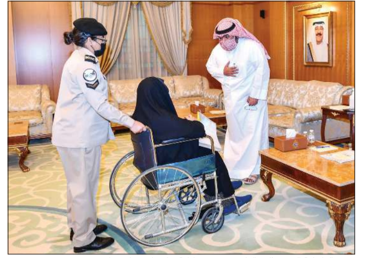
وزير الداخلية الشيخ ثامر العلي يرحب بمواطنة خلال استقبال مراجعين

التنسيق والتعاون بين المؤسسة الأمنية ومؤسسات المجتمع المدني، مؤكداً على دعم ومساندة وزارة الداخلية لفعاليات وأنشطة الجمعية الثقافية الاجتماعية النسائية، حتى تؤدي دورها في خدمة المجتمع. من جانبهم، أعرب أعضاء الجمعية عن شكرهم وتقديرهم لوزير الداخلية على حسن الاستقبال، متمنين دور وزارة الداخلية في تذليل العقبات أمام مؤسسات المجتمع المدني حتى تقوم بدورها على أكمل وجه. يشار إلى أن وزير الداخلية يستقبل المواطنين