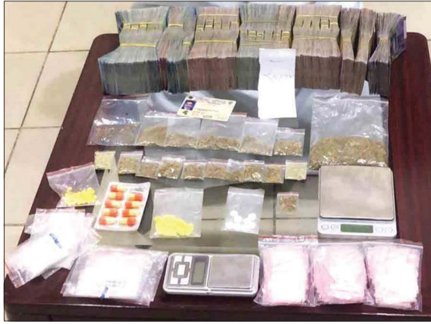
المضبوطات من المواد المخدرة والحبوب والمبلغ المالي