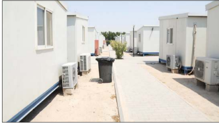
سكن عمال شركة «ليماك» العاملين بمشروع المطار