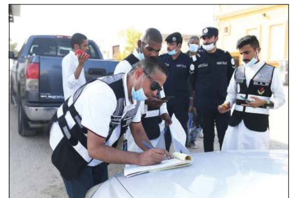
تسجيل إحدى المخالفات