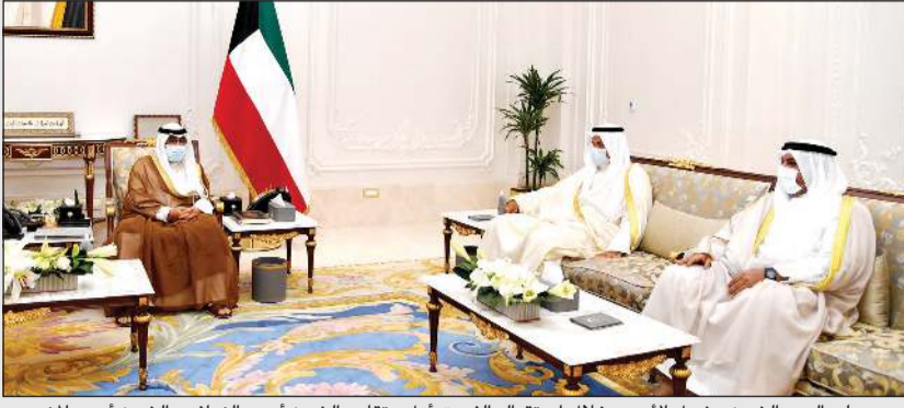
سمو ولي العهد الشيخ مشعل الأحمد خلال استقباله الفريق أول متقاعد الشيخ أحمد النواف والشيخ أحمد المنصور