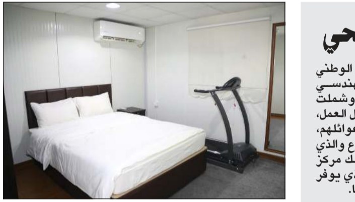
إحدى غرف العمال

بعد اختتام برنامج التوزيع الذي استمر أربعة ايام، ان البعثة ركزت على توزيع لحوم الاضاحي على اللاجئين الكافئين في المخيمات العشوائية وشرائح كبار السن والنساء وذوي الاحتياجات الخاصة في محافظات اردنية مختلفة. وأوضح ان البعثة وزعت حصصا من لحوم الاضاحي على اعضاء نادي الصم الاردني من النساء والرجال والاطفال داخل العاصمة قبل ان تنتقل عملية التوزيع إلى المخيمات العشوائية التي يقطنها اللاجئون السوريون وبعض الاسر الفقيرة والمحتاجة في محافظات عمان ومادبا والكرك.