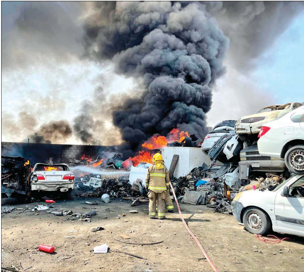
فرق الإطفاء حاصرت الحريق وأخمده دون إصابات

وعلى اثره تم توجيه فرق الإطفاء والتي عملت على محاصرة الحريق وتمكنت من السيطرة عليه دون وقوع اي اصابات بشرية.