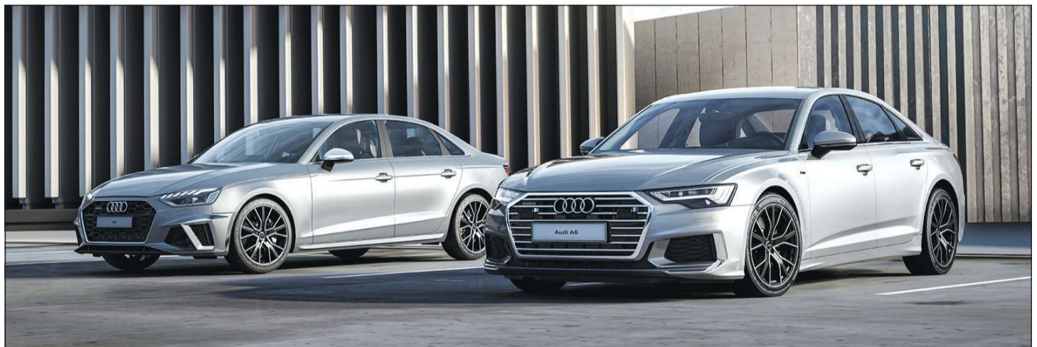
أودي A6 & A4

الجديدة خلال موسم الصيف، خاصة للصوف الأمامية من جميع الأماكن، ويقدم العرض الجديد للعملاء مزايًا فريدة من نوعها، إضافة إلى باقة الكفالة، الخدمة والصيانة الممددة، وتدعو جميع عملائنا لزيارة معرضنا والتطلع على أحدث عروضنا المتوفرة.