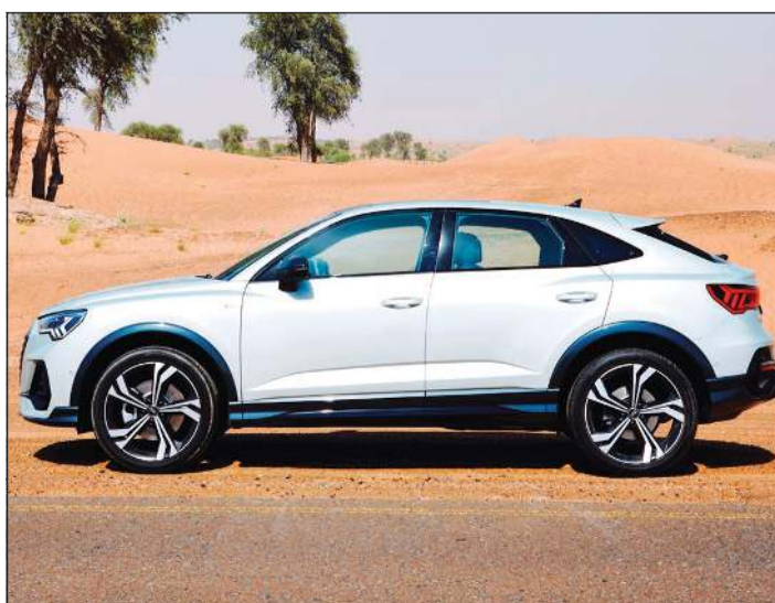
أودي Sportback Q3

ويتضمن العرض الخاص تخفيضات وأسعار خاصة على جميع سيارات أودي المتوفرة، إضافة إلى ذلك، جميع سيارات أودي متوافرة بكفالة ممددة 5 سنوات، خدمة 5 سنوات، صيانة 5 سنوات وخدمة مساعدة على الطريق لمدة 5 سنوات، وتتضمن تشكيلة سيارات أودي من A4 العصرية إلى Q8 العائلية، وبأسعار تبدأ من 14500 دينار. متحدثاً عن العرض، قال