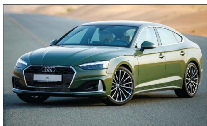
أودي Sportback A5

يشار إلى أن طرازات أودي معروضة ومتوافرة لتجربة القيادة 6 أيام في الأسبوع لدى معرض أودي الكويت المتواجد في منطقة الشويخ الصناعية - طريق الجھراء (شارع البيسي) أثناء الدوام الرسمي من الساعة 9:00 صباحاً وحتى الساعة 8:00 مساءً، من يوم السبت إلى الخميس.