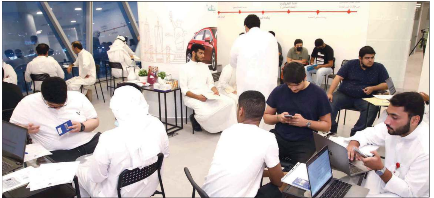
«خلية نحل» داخل اتحاد الكويت - فرع الولايات المتحدة لمساعدة المبتعثين الجدد

رصدنا داخل موقعه الجديد في برج التجارية الجهود المكثفة للمساهمة في تقديم النصائح للمبتعثين الجدد ومساعدتهم في تسريع استخراج «الفيزا»