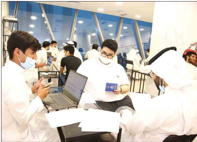
جانب من اللقاءات مع الطلبة المستجدين