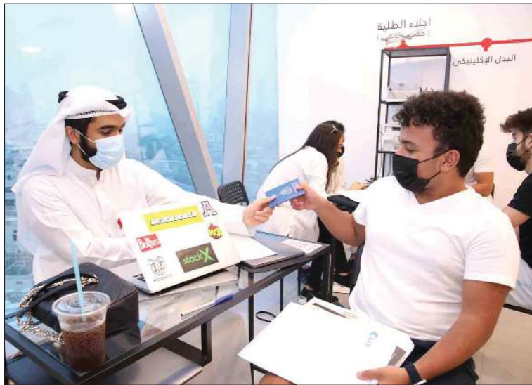
إنجاز تسجيل بيانات أحد الطلبة المبتعثين