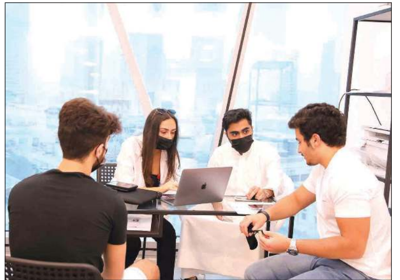
توفير جميع وسائل الدعم للطلبة المستجدين

العالي والملاحق الثقافية مع كافة مطالب الاتحاد، موضحاً أن التواصل مستمر ومباشر مع كافة المسؤولين ولهم خالص الشكر والتقدير. وذكر الرفاعي أن الدراسة وفق نظام «الأونلاين» تختلف عن الدراسة وفق النظام التقليدي، لافتاً إلى أن الاتحاد حاول تهيئة بيئة مناسبة للطلاب وضمان تحقيق الطالب للاعتماد الأكاديمي فيما يخص مواد «الأونلاين».