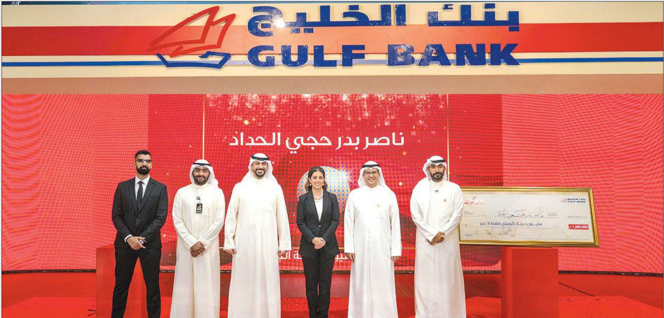
الإدارة التنفيذية لبنك الخليج مع ممثلي وزارة التجارة وشركة «إرنست آند يونغ»