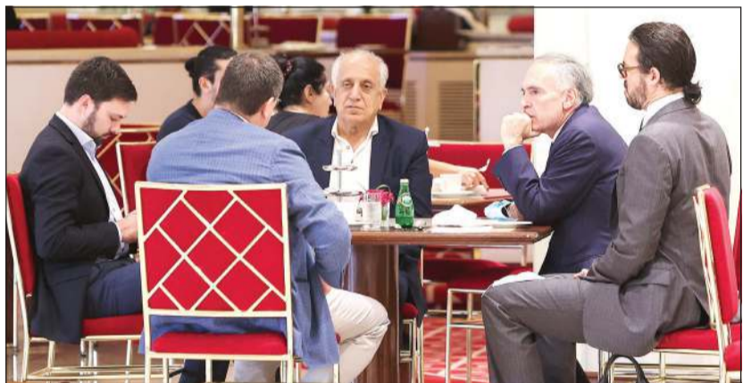
المبعوث الأميركي الخاص بأفغانستان زماي خليل زاد على هامش مشاركته في مباحثات السلام بالذوحة

وقال عبدالله عبدالله، في تصريحات للصحافيين قبيل بداية الجلسة، إن الوفد الحكومي قد جاء إلى الذوحة يحمل تفويضا كاملا وصلاحيات كاملة، مؤكدا أن الشعب هو المروته من الطرفين». مؤكدا أن الشعب هو الخاسر من استمرار الاقتتال والعنف. وتقرر، في الجلسة التي لم تستمر طويلا، تشكيل لجنة مشتركة من الوفدين مكونة من 14 عضوا لوضع جدول لأجندة التفاوض. وقالت مصادر دبلوماسية حضرت الجلسة الافتتاحية لوكالة الأنباء الألمانية (د.ب.أ) إن «الجلسة الافتتاحية اتسمت بأجواء إيجابية وتعاون». واجتمع ممثلو الحكومة وطالبان، بينما تدور معارك طاحنة على الأرض بالتزامن مع انسحاب القوات الأجنبية من أفغانستان بعد وجود دام 20 عاما. وعززت طالبان تقدمها في الشمال، حيث استمرت المعارك العنيفة في بلدة أمير الحرب عبدالرشيد دستم التي تحاذي تركمانستان. وقالت فرنسا بإجلاء نحو مائة من مواطنيها والأفغان العاملين لدى سفارتها في العاصمة مع تدهور الوضع الأمني، على ما أفاد مصدر دبلوماسي.