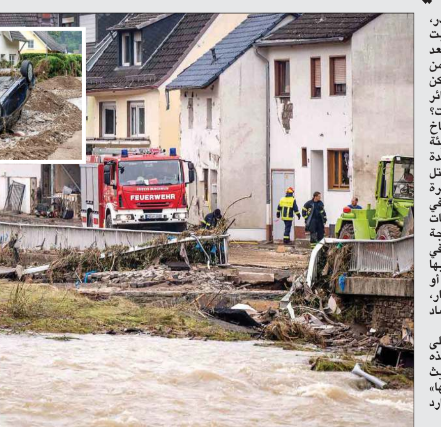
«أ.ف.ب.»: في حدث نادر، أودت الفيضانات التي ضربت أوروبا وأجزاء من ألمانيا بعد هطول أمطار غزيرة، بأكثر من 150 شخصا حتى الآن. كيف يمكن أن تقع مأساة كهذه بكل الخسائر الجسيمة في الأرواح والممتلكات؟ أوضح جان جوزيل عالم المناخ ونائب الرئيس السابق لهيئة المناخ التابعة للأمم المتحدة لوكالة «فرانس برس» أن الكتل الهوائية المحملة بنسبة كبيرة من الماء، بقيت في مكانها في الأجواء أربعة أيام بسبب درجات الحرارة المنخفضة، والنتيجة هي هطول أمطار غزيرة، في 14 و15 يوليو، وصل منسوبها إلى بين «100 و150 مليمترا»، أو ما يعادل شهرين من الأمطار، بحسب المنظمة العالمية للأرصاد الجوية. ورغم أن المنطقة معتادة على هطول أمطار غزيرة، كانت هذه المتساقطات «استثنائية من حيث كمية المياه التي تدفقت وشدتها» كما علق كاي شروت عالم الموارد المائية في جامعة بوتسدام.