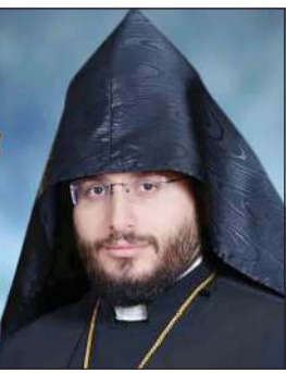
الارشمترتير بدروس ماتويليان

القرن الماضي، وما زال يشهد ثباتا، لافتا إلى التطور المستمر في العلاقات الثنائية خلال سنوات عدة، مضيفا أن الصداقة القائمة بين البلدين تقوم على الحب المتبادل وقال إن الكويت تعد من الدول المتميزة في التعايش بين الأديان في المنطقة. وأشاد المطران بجهود الكويت الإنسانية والخيرية المحمودة وإسهاماتها في أعمال الخير وتقديم المساعدات للجميع دون أي تفرقة لذلك حصلت الكويت على مركز الإنسانية في العالم، كما أشاد المطران بالإجراءات المتخذة في الكويت لمواجهة أزمة كورونا ومنع انتشار الفيروس في البلاد وتخفيف العواقب السلبية.