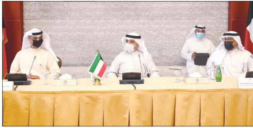
الشيخ د.أحمد ناصر المحمد خلال اجتماعه مع مساعدي وزير الخارجية

كما بعث سمو نائب الأمير وولي العهد الشيخ مشعل الأحمد ببرقية تعزية إلى الرئيس د.فرانك فالتر شتاينماير رئيس جمهورية ألمانيا الاتحادية الصديقة ضمنها سموه خالص تعازيه وصادق مواساته بضحايا الفيضانات التي غمرت ولاية «نورد راين فستفاليا» جراء الأمطار الغزيرة، راجيا سموه للمصابين الشفاء العاجل.