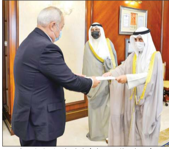
الشيخ د.أحمد ناصر المحمد يتسلم أوراق اعتماد سفير قبرغيزستان