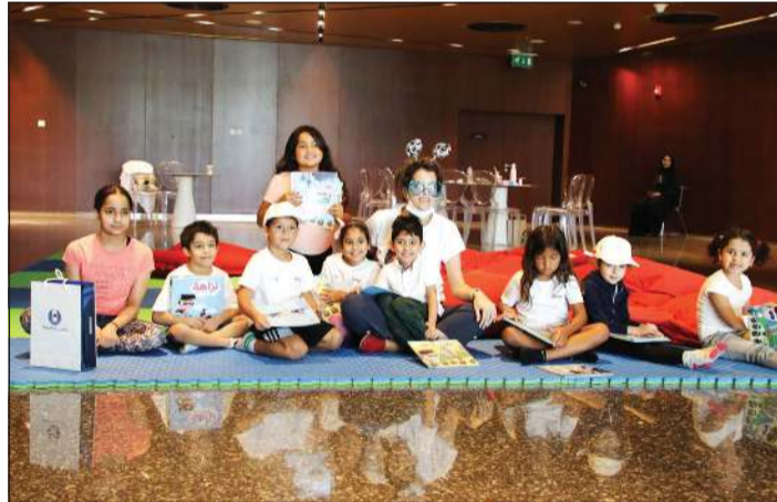
جانب من الأنشطة