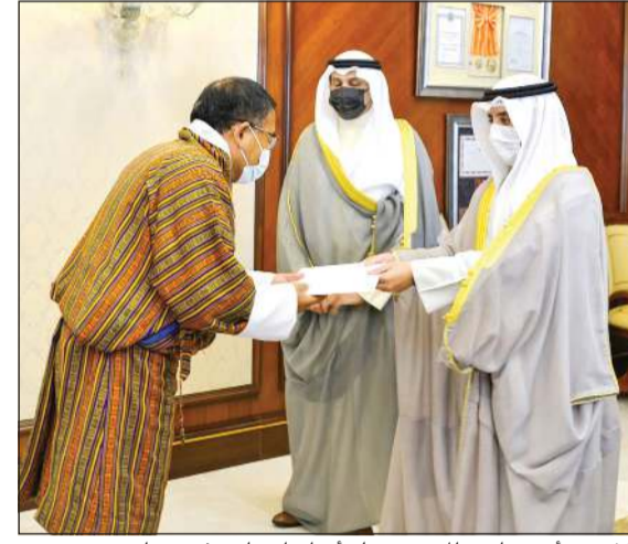
الشيخ د.أحمد ناصر المحمد يتسلم أوراق اعتماد سفير بوتان

سفير جمهورية قبرص المين لدى الكويت مايكل مافروس، وذلك خلال اللقاء الذي تم في ديوان عام وزارة الخارجية. وتمنى وزير الخارجية للسفير الجديد التوفيق في مهام عمله وللعلاقات الثنائية الوثيقة التي تجمع البلدين الصديقين المزيد من التقدم والإزدهار.