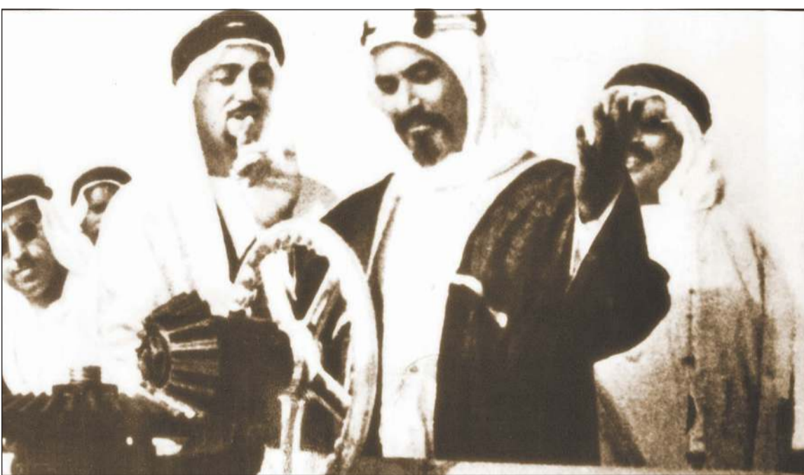
الشيخ أحمد الجابر الصباح - رحمه الله - يدير الدولاب الفضي إيداناً بتصدير أول شحنة من نفط الكويت بتاريخ 1946/6/30

ومن ينطق بهذا المثل فهو يعيب على هذا المسرف عدم عنايته بماله في حيث وضعه في المكان المأمور، وضرورة عدم صرفه إلا فيما هو مفيد مع الاهتمام بتنميره. (الجله): تتطرق الجيم في اللهجة بياء فيقال: البيله، وهي زنبيل كبير