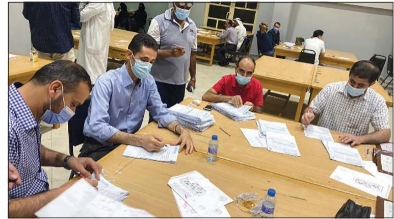
جانب من عملية التصحيح في الكنترول

في توجه الوزارة مع عدم وجود إزام بتطعيم الطلبة حتى الآن