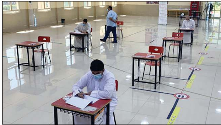
الطلبة في إحدى قاعات الاختبار