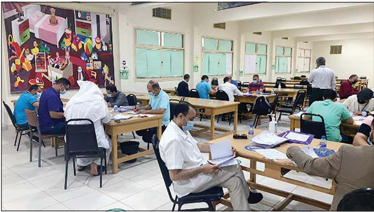
عملية التصحيح في الكنترول