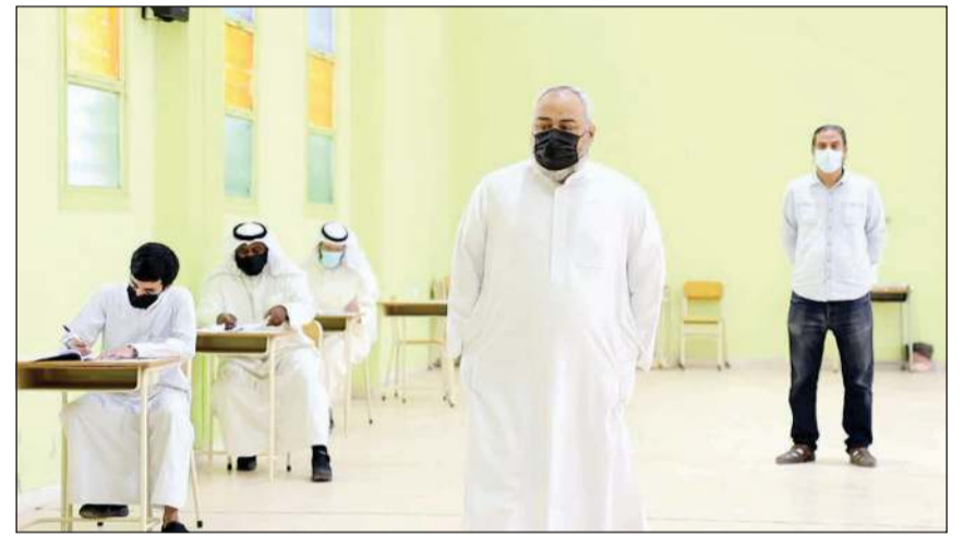
الطلبة يؤدون الامتحان في إحدى اللجان

الثاني عشر بقسميه العلمي والأدبي والمنزل والتعليم الكبار ستطلق يوم الأحد المقبل. وأضاف السلطان أن الدور الأول سيحتسب للطلاب الذين كانوا مصابين بفيروس «كورونا» أو بوضع الحجر الصحي، لافتاً إلى أنه تم توزيع