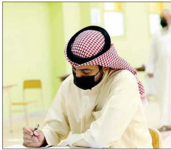
الحرص على تطبيق الاشتراطات الصحية

بحسب المادة التي سيختبر فيها الطالب. ولفت السلطان إلى أن الأمور تسير على ما يرام ووفق الخطة الموضوعية لها، وسيتم تصحيح أوراق الاختبارات بصورة يومية، على أن تظهر النتائج بعد الانتهاء من التصحيح بفترة بسيطة لا تتجاوز يومين، متمنياً أن يكون ذلك تاهيلاً ومُدخلاً لعودة الطلاب للمدارس في العام الدراسي المقبل، معرباً عن أمله في أن يشهد وباء «كورونا» انحساراً مع الاستمرار بعملية التطعيم والوصول للمناعة المجتمعية، مكرراً شكره لجميع من ساهم في نجاح الاختبارات الورقية.