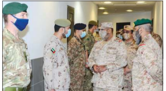
رئيس الأركان في حديث مع عدد من المشاركين في التخطيط والتنفيذ للتمرين