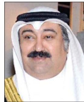
السفير وليد الخبيزي

د.فيليب أيكمان وجرى خلاله التأكيد على عمق العلاقات الثنائية المتشددة لأكثر من 57 عاماً. وأشاد الخبيزي بالتنسيق والتعاون المشترك والتسويق المستمر بين البلدين خلال فترة عضويتهم غير الدائمة في مجلس الأمن، معرباً عن تطلع