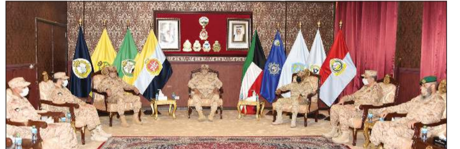
الفريق الركن خالد صالح الصباح والفريق الركن فهد الناصر وعدد من أعضاء مجلس الدفاع العسكري خلال الزيارة إلى كلية مبارك العبدالله للقيادة والأركان المشتركة