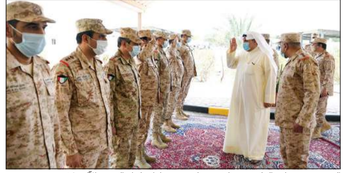
الشيخ حمد جابر العلي محبياً مستقبليه من قيادات لواء السور الآلي 26