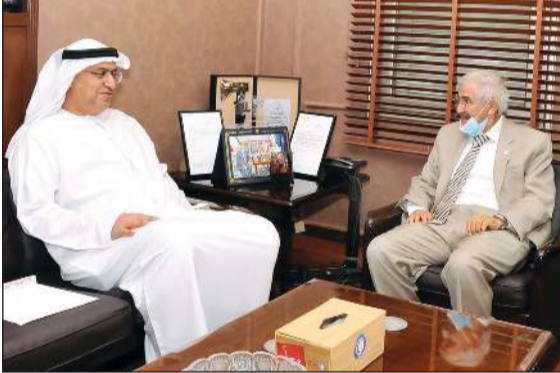
السفير الإماراتي د.مطر النديدي ود.هلال السايير

أسامة دياب في إطار سلسلة الندوات التي تقيمها سفارة دولة الإمارات العربية المتحدة لدى الكويت بين المختصين في البلدين الشقيقين، أقامت السفارة لدى البلاد ندوة افتراضية بعنوان «الثقافة ودورها في العمل الدبلوماسي»، وذلك بمشاركة د.زكي أنور نسيبه مستشار صاحب السمو الشيخ خليفة بن زايد آل نهيان للشؤون الثقافية