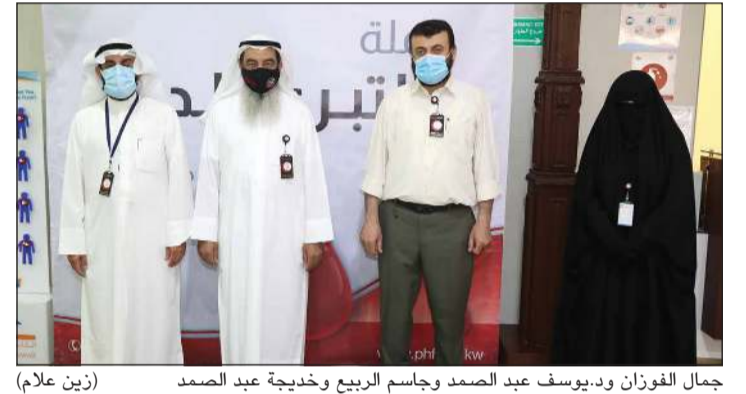
جانب من المتبرعين