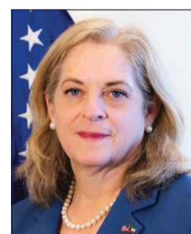
السفيرة الينا رومانوسكي

وأشارت إلى أن بلادها تقوم حالياً بتحديد المتقدمين للحصول على تأشيرة الهجرة الخاصة - من أولئك الذين عملوا مترجمين فوريين وكذلك مترجمين مع القوات الأميركية - ليتم نقلهم خارج أفغانستان قبل استكمال الانسحاب العسكري في سبتمبر. ولغقت إلى أنه على الرغم من عدم وجود معلومات حالياً عن مواقع محددة أو دول بعينها لنقل المترجمين، ستتم وفقاً للقوانين المعنية وبالتنسيق الكامل مع الكونغرس.