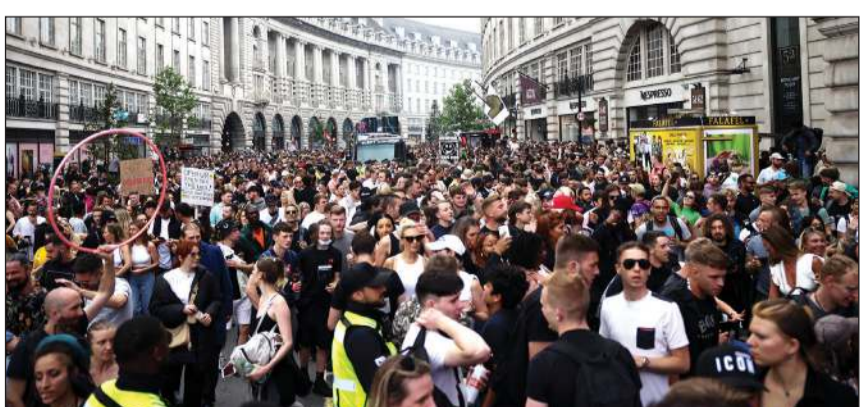
بريطانيون يتظاهرون احتجاجاً على الإجراءات الاحترازية لاحتواء «كورونا» في لندن

كورونا بإعادة فرض القيود على نطاق واسع. فقد دخلت مدينة سيدني أمس تدابير إغلاق جديد لمدة أسبوعين، وأعلنت العاصمة الروسية موسكو أمس عن حصيلة وفيات قياسية مرتفعة بمقدار 33٪ خلال أسبوع، فيما أعيد فرض قيود في منطقة آسيا والمحيط الهادئ. في المقابل، لا يزال التوجه السائد في عدة دول أوروبية هو تخفيف القيود. وبدأت بلجيكا أمس المرحلة الثانية من «خطة الصيف»، أما في إسبانيا وسويسرا، فقد ألغيت الإلزامية وضع الكمامات في الفضاءات المفتوحة منذ أمس الأول، وهو قرار يدخل حيز التنفيذ في إيطاليا اعتباراً من اليوم. التفاصيل من 20