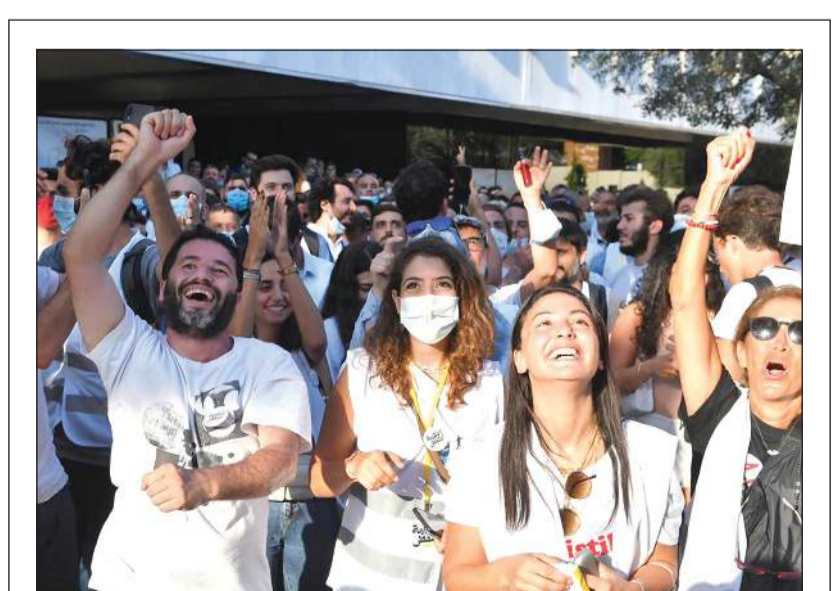
مهندسون يحتفلون بفوز لائحة «القبالة تنتفض» في انتخابات مجلس المندوبين لقيادة المهندسين اللبنانيين

شباب إسبانيا تحت مجهر أبناء كرواتيا طموح سويسرا يصطم بعنفوان «الديوك» مدرّب النمسا: دفعنا ثمن الأخطاء أمام إيطاليا