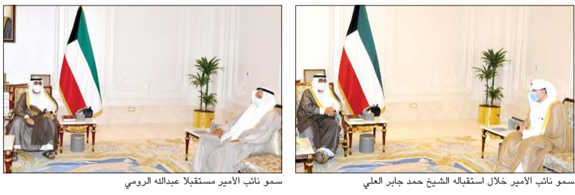
سمو نائب الأمير مستقبلاً عبدالله الرومي

استقبل سمو نائب الأمير وولي العهد الشيخ مشعل الأحمد، صباح أمس رئيس مجلس الأمة مزروق الغانم. كما استقبل سمو نائب الأمير وولي العهد سمو رئيس مجلس الوزراء الشيخ صباح الخالد . واستقبل سمو نائب الأمير وولي العهد نائب رئيس مجلس الوزراء وزير الدفاع الشيخ حمد جابر العلي. كما استقبل سمو نائب الأمير وولي العهد نائب رئيس مجلس الوزراء وزير الدولة لشؤون تعزيز النزاهة عبدالله الرومي. الى ذلك، بعث سمو نائب الأمير وولي العهد الشيخ مشعل الأحمد برفيقة تهنئة إلى رئيس مجلس أمناء جامعة الشرق الأوسط الأمريكية (AUM) وأعضاء مجلس أمناء الجامعة ضمنها سموه أطيب تهنائه وذلك بمناسبة حصول الجامعة على التصنيف الأول محلياً والثالث والثلاثين عربياً في تصنيف (QS) العالمي للجامعات، مشيداً سموه بالجهود الكبيرة والمتميزة من القائمين على هذا الصرح الأكاديمي المتميز والتي توجت بحصول الجامعة على المركز المرموق في التصنيف العالمي الذي شمل 1300 جامعة من 93 بلداً حول العالم، متمناً سموه بكل فخر واعتزاز الرؤية الشاملة والإدارة المتميزة والأفكار المهمة وحرص الجامعة على الاستمرار في العصر البشري باعتباره ركيزة أساسية لتقدم وطننا العزيز وازدهاره. سائلاً سموه المولى العلي القدير أن ينعم على الجميع بموفور الصحة ونتمام العافية وأن يوفقهم نحو مزيد من التقدم والازدهار وأن يحفظ وطننا العزيز في ظل القيادة الحكيمة لصاحب السمو الأمير الشيخ نواف الأحمد، حفظه الله ورعاه، وسدد بالتوفيق على دروب الخير خطاه. كما بعث سمو نائب الأمير وولي العهد الشيخ مشعل الأحمد برفيقة تهنئة إلى المدير العام للمؤسسة العامة للتأمينات الاجتماعية مشعل العثمان وأعضاء مجلس المؤسسة وفريق الاستمرار وأعضاء سموه أطيب تهنائه بما تحققت من عوائد