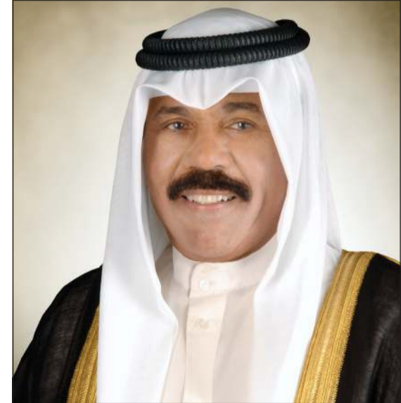
صاحب السمو الأمير الشيخ نواف الأحمد

بعث صاحب السمو الأمير الشيخ نواف الأحمد برفيقة تهنئة إلى وزير التربية د.علي المصفي ووكيل وزارة التربية والوكلاء المساعدين ومديري المناطق التعليمية في الوزارة، أعرب فيها سموه عن خالص تهنائه بتجاح إدارة الاختبارات الورقية التي عقدت لطلبة الصف الثاني عشر في الدور الأول للعام الدراسي (2020-2021) مقدراً سموه الجهود التي بذلها المسؤولون في وزارة التربية على كل المستويات في الإعداد والتحضير لهذه الامتحانات في ظل جائحة (كورونا) وما تم اتخاذه من إجراءات صحية واحترازية أسهمت في تمكين الطلبة والطالبات من أداء الامتحانات بكل سهولة ويسر، ومتمنيا سموه لأبنائه وبناته الطلبة والطالبات كل التوفيق والنجاح لإكمال مسيرتهم التعليمية.