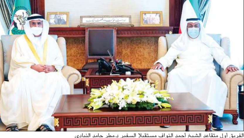
الفريق أول متقاعد الشيخ أحمد النواف مستقبلاً السفير د.مطر حامد النيايدي

استقبال الفريق أول متقاعد الشيخ أحمد النواف نائب رئيس الحرس الوطني في ديوانه بالرئاسة العامة للحرس الوطني، د.مطر حامد النيايدي سفير دولة الإمارات العربية المتحدة الشقيقة لدى الكويت. ورحب نائب رئيس الحرس الوطني بسفير دولة الإمارات العربية المتحدة الشقيقة، وتم خلال اللقاء بحث الموضوعات ذات الاهتمام المشترك والتأكيد على أهمية تعزيز العلاقات بين البلدين الشقيقين.