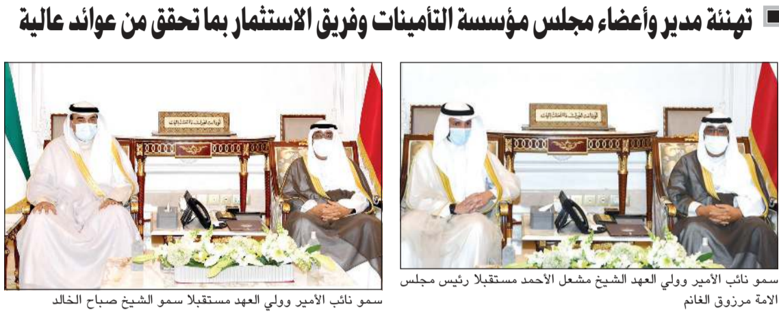
سمو نائب الأمير وولي العهد مشعل الأحمد مستقبلاً رئيس مجلس الأمة مزروق الغانم

استقبل سمو نائب الأمير وولي العهد الشيخ مشعل الأحمد، صباح أمس رئيس مجلس الأمة مزروق الغانم. كما استقبل سمو نائب الأمير وولي العهد سمو رئيس مجلس الوزراء الشيخ صباح الخالد . واستقبل سمو نائب الأمير وولي العهد نائب رئيس مجلس الوزراء وزير الدفاع الشيخ حمد جابر العلي. كما استقبل سمو نائب الأمير وولي العهد نائب رئيس مجلس الوزراء وزير الدولة لشؤون تعزيز النزاهة عبدالله الرومي. الى ذلك، بعث سمو نائب الأمير وولي العهد الشيخ مشعل الأحمد برفيقة تهنئة إلى رئيس مجلس أمناء جامعة الشرق الأوسط الأمريكية (AUM) وأعضاء مجلس أمناء الجامعة ضمنها سموه أطيب تهنائه وذلك بمناسبة حصول الجامعة على التصنيف الأول محلياً والثالث والثلاثين عربياً في تصنيف (QS) العالمي للجامعات، مشيداً سموه بالجهود الكبيرة والمتميزة من القائمين على هذا الصرح الأكاديمي المتميز والتي توجت بحصول الجامعة على المركز المرموق في التصنيف العالمي الذي شمل 1300 جامعة من 93 بلداً حول العالم، متمناً سموه بكل فخر واعتزاز الرؤية الشاملة والإدارة المتميزة والأفكار المهمة وحرص الجامعة على الاستمرار في العصر البشري باعتباره ركيزة أساسية لتقدم وطننا العزيز وازدهاره. سائلاً سموه المولى العلي القدير أن ينعم على الجميع بموفور الصحة ونتمام العافية وأن يوفقهم نحو مزيد من التقدم والازدهار وأن يحفظ وطننا العزيز في ظل القيادة الحكيمة لصاحب السمو الأمير الشيخ نواف الأحمد، حفظه الله ورعاه، وسدد بالتوفيق على دروب الخير خطاه. كما بعث سمو نائب الأمير وولي العهد الشيخ مشعل الأحمد برفيقة تهنئة إلى المدير العام للمؤسسة العامة للتأمينات الاجتماعية مشعل العثمان وأعضاء مجلس المؤسسة وفريق الاستمرار وأعضاء سموه أطيب تهنائه بما تحققت من عوائد