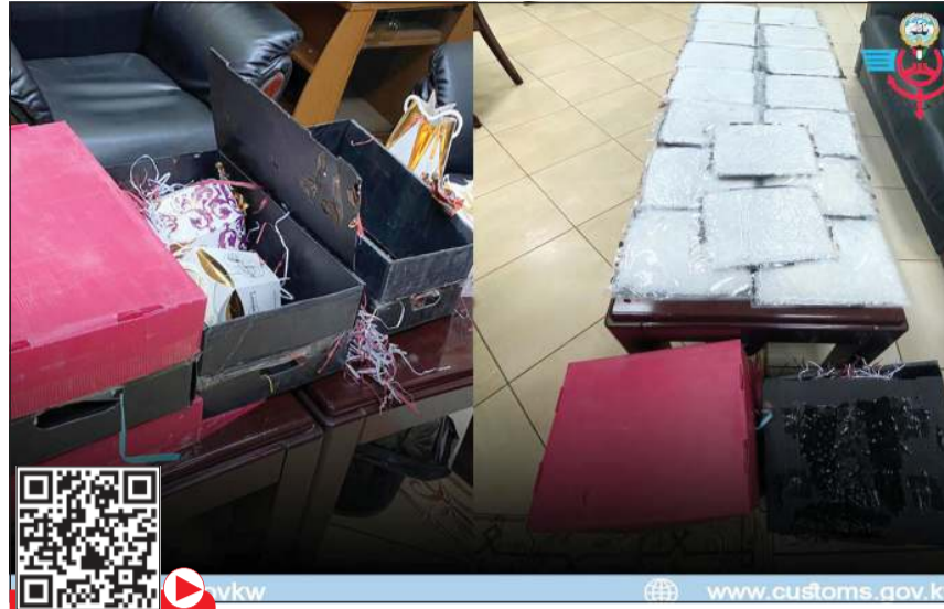
الشبو الهرب عبر 5 طرود بريدية ظاهره شيكولاتة

(18) صندوقاً (علبة) كروتونياً بداخلها الواح شيكولاتة قادمة من الجمهورية الإسلامية الإيرانية، وبعد تفقيشها بدقة عثر بداخل (16) صندوقاً منها على مادة الشبو النقي بما مجموعه 5,400 كيلو غرامات، مخبأة أسفل الواح الشوكولاتة. مشيرة الى انه تم القبض على المتهم أثناء استلام الشحنة، واتضح أنه من جنسية عربية. التي ذلك قال مصدر امني لـ «الانباء» ان العربي الذي اعلنت عنه الجمارك هو واقد من الجنسية العراقية، لافتا الى ان قوة من الادارة العامة لمكافحة المخدرات استلمت العراقي والمضبوطات تمهيدا للتحقيق معه. وحول الشبو المخبأ في حاوية مواد غذائية، قال مصدر جمركي ان رجال ميناء الشويخ اشتبهوا في حاوية مواد غذائية قادمة من إيراني وتبين ان