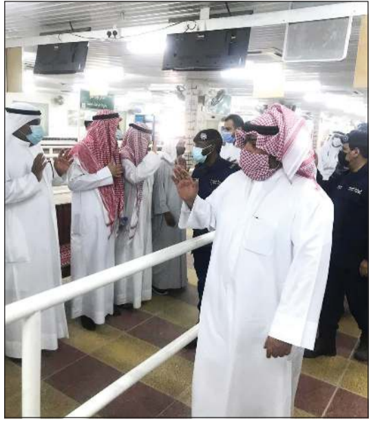
الشيخ ثامر العلي والفريق عصام النهام خلال تقديم واجب العزاء

تقدم وزير الداخلية الشيخ ثامر العلي ووكيل الوزارة الفريق عصام النهام جنازة الوكيل أول ضابط صالح الرشيد من مرتبات الإدارة العامة لقوات الامن الخاصة والذي توفي جراء تداعيات إصابته بفيروس كورونا خلال أداء مهام عمله.