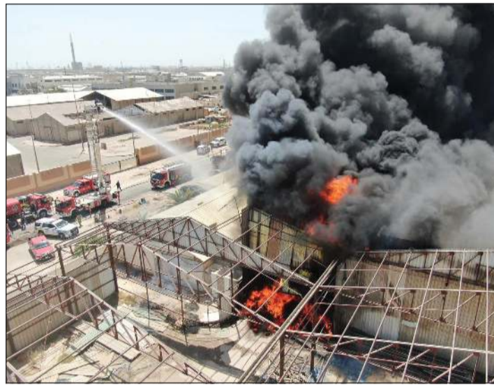
حريق مخزن الشويخ خلف سحباً دخانية كثيفة

المجاورة للمخزن الذي يحتوي على أخشاب ومحركات وأجهزة كهربائية ومواد أخرى بمساحة تزيد عن 5 آلاف متر مربع، مشيرة الى ان الفرق العاملة واجهت عدة معوقات منها عدم