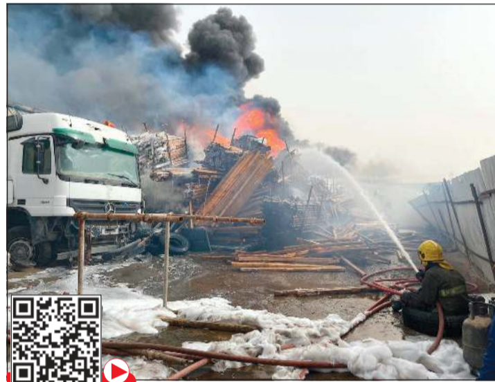
إطفائي يسيل المياه على حريق مخزن أمفرة لمنع تشعبه