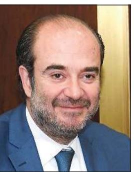
النائب جورج عقيص

اعتبر عضو كتلة القوات اللبنانية النائب جورج عقيص أن «هناك أجندة متصارعة بموضوع تشكيل الحكومة والوضع اللبناني»، ورأى أن حرب الأجنداث الخارجية والداخلية، هي من تعطل تشكيل الحكومة، إذ أن البعض من الفرقاء والأطراف السياسية اللبنانية ينتظرون نتائج المفاوضات الإيرانية - الأميركية حول الملف النووي الإيراني، بصورة الخريطة الجديدة في الشرق الأوسط في ظل التغييرات الحاصلة، وما يجري في إسرائيل، وأشار إلى أن بعض الجهات تعرقل كل تمسك بقايا مواقع قوية لها، بعد انتهاء الولاية الرئاسية».