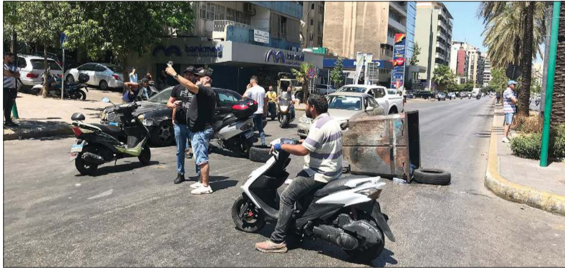
اقفال طرقات في بيروت بحاويات النفايات خلال الاضراب بدعوة من الاتحاد العمالي العام