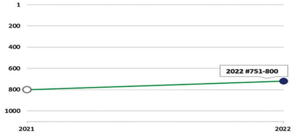
رسم بياني يوضح تقدم تصنيف جامعة الشرق الأوسط الأمريكية (AUM)

بِسْمِ اللَّهِ الرَّحْمَنِ الرَّحِيمِ يَا أَيُّهَا الْمَلَأُ الْأَعْيُنُ وَالرَّأْسُ الْأَضْيَانُ فَاتَّقُوا اللَّهَ عِبَادَ اللَّهِ إِنَّ اللَّهَ سَدِيدُ الْعِقَابِ