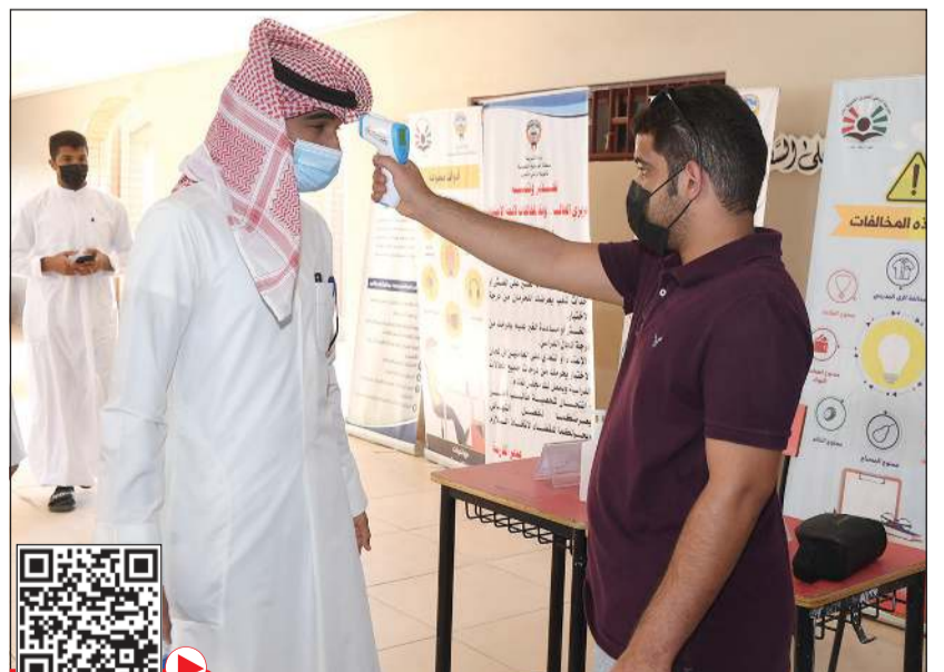
إجراءات صحية قبل دخول لجان الامتحانات (محمد هاشم)