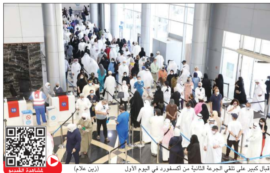
إقبال كبير على تلقي الجرعة الثانية من أكسفورد في اليوم الأول (زين علام)