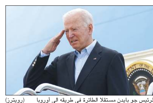
الرئيس جو بايدن مستقلاً الطائرة في طريقه إلى أوروبا

لبوتين والصين أن التحالف بين الولايات المتحدة وأوروبا متين. كما أكد أنه يعتزم الكشف عن استراتيجية لقاح عالمية قريباً. وسيحضر الرئيس الأمريكي الديموقراطي الذي ترافقه زوجته جيل قمة مجموعة الدول الصناعية السبع الكبرى في كورنوال، التي ستكون من أولوياتها قضايا جائحة «كوفيد-19» والمناخ.