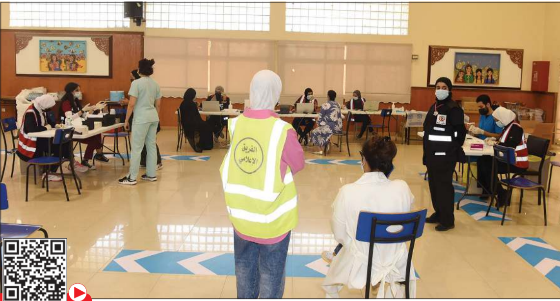
تنظيم جيد مع الحفاظ على التباعد في ثانوية العصماء بنت الحارث