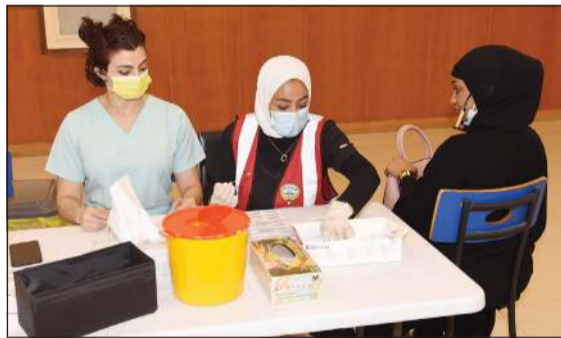
فحص إحدى طالبات الثانوية

وفيما يبدأ طلبة المعهد الديني اختباراتهم اليوم الثلاثاء بامتحان اللغة العربية قامت مدير الشؤون التعليمية لمنطقة مبارك الكبير التعليمية أمال الرويشد بزيارة تفقدية لمركز الصحة الوقائية الموضوعية فحص الـ PCR في ثانوية جابر العلي للاطمئنان على تطبيق الاشتراطات الصحية والإجراءات الاحترازية قبل بداية الامتحانات الوردية للصف الثاني عشر للعام