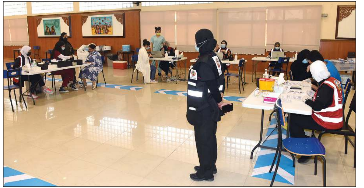
إجراءات ميسرة لعمل مسحات الـ PCR، للطالبات (أحمد علي)