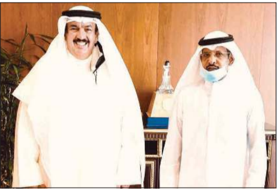
د.علي المضف خلال استقباله صالح العازمي

أكد وزير التربية د.علي المضف دعمه الكامل لمطالب العاملين في وزارة التربية، مشدداً على أنه لن يسمح بهضم حقوق أي معلم أو موظف بالتربية. جاء ذلك خلال استقبال الوزير المضف بمكتبه رئيس نقابة العاملين بوزارة التربية صالح الحليمة العازمي، حيث تم نقاش عدد من مطالب النقابة التي وعد الوزير بحلها فوراً.