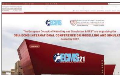
المؤتمر يعزز من موقع الكويت العلمي