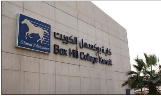
كلية بوكسهل تؤهل خريجها للتميز في سوق العمل

استضافت كلية بوكسهل الكويت عدداً من الخبراء في قطاع المؤسسات المالية وشركات الاستثمار في حلقة نقاشية عبر منصة تيمز الإلكترونية تتناول تطور هذا القطاع في الكويت والمستقبل الوظيفي فيه، خاصة أن كلية بوكسهل الكويت تتميز في منح مؤهل ببلوم في إدارة الخدمات المصرفية.