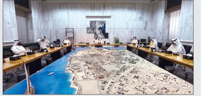
أسامة العتيبي مترشدا اجتماع مكتب المجلس البلدي

عقد مكتب المجلس البلدي اجتماعه أمس برئاسة أسامة العتيبي حيث بحثت عدة مواضيع منها كتاب جمعية المحامين الكويتية بشأن اتفاقية تعاون بين المجلس البلدي والجمعية، حيث تم التوصية بإعداد المسودة النهائية لهذه الاتفاقية