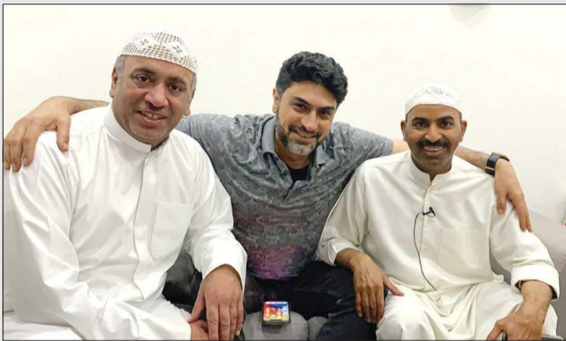
المنتج عيسى العلوي يتوسط العلي والعنوان

يدخل أحد البيوت المهجورة معتقدا انه من بيوت الأثرياء وسيجد السعادة فيه، وأنه يريد ان يحيا حياة اصحاب هذا البيت، ومن كثرة الهلوسة اعتقد انه سرق البيت بل وقام بالاتصال على الشرطة ليبلغ عن نفسه بعد ان اكتشف أن السعادة ليست بالبيوت الفارغة