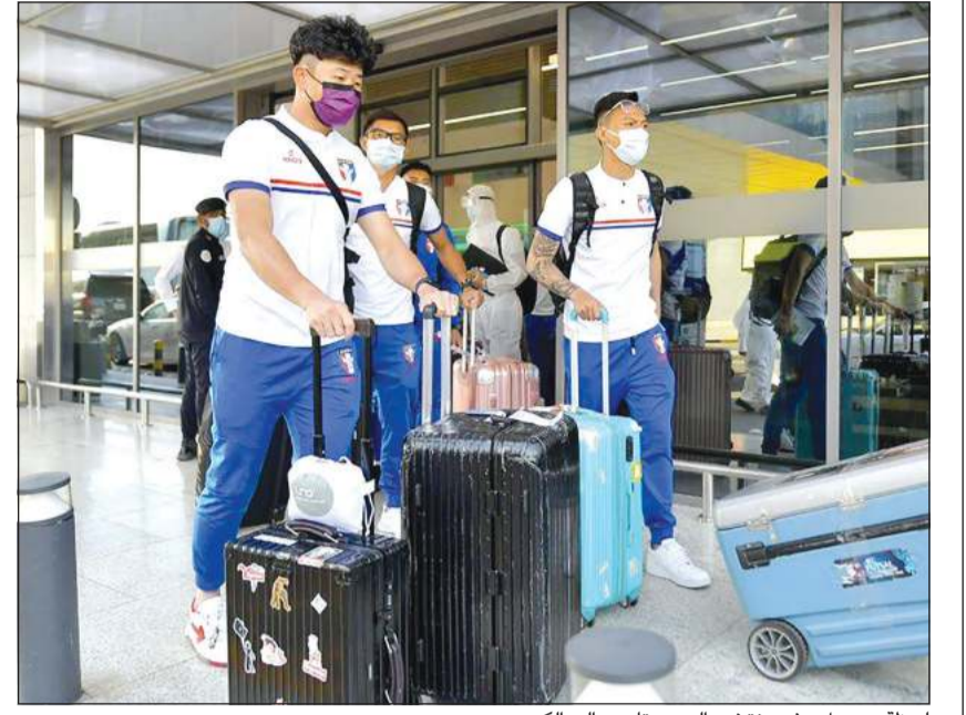
لحظة وصول وفد منتخب الصين تايبه إلى الكويت