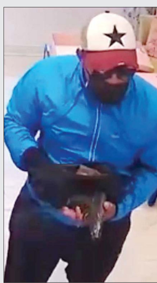
المتهم استخدم بدأ واحدة في مراحل السرقة

أكد مصدر أمني أن رجال الادارة العامة للمباحث الجنائية يكثفون جهودهم لإغلاق ملف قضية السطو على محل كاكاو والذي تعرض له أحد محلات بيع الشيكولاتة الفاخرة في منطقة السالمية، وتمكن الجاني الأربعة الماضي من سرقة 800 دينار بعد أن هدد بائع المحل بسلاح ناري أو ما يشبه السلاح الناري، وكان يحتفظ به داخل حقيبة سوداء صغيرة دخل بها إلى المحل وتظاهر بإخراج حافظة نقود منها فيما كان يخرج السلاح المستخدم في الواقعة. ورغم ترجيح المصدر أن يكون الجاني من جنسية عربية، إلا أنه قال إن هذا الاحتمال ورغم أنه قائم من خلال لغة الحديث مع البائع وطريقة تعامله في الواقعة، إلا أن المجال مفتوح لأن يكون المتهم بخلاف ذلك، وتظاهر بأنه وافد حتى يستكمل ما بدأه من مراحل التخفي واختباء بالكمامة والنظارة، بحيث لا تتكشف ملامحه، منوها إلى ان الجاني حرص على عدم ترك أي بصمة له أن استخدم يده التي كان بها قفاز خلال مراحل السرقة فيما لم يستخدم اليد الأخرى والتي خلت من القفاز حتى حينما