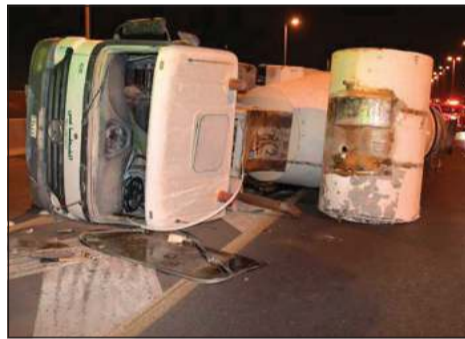
الخلطاط وقد انقلب على جانبه

سعود عبدالعزيز-عبدالله قنيص تمكن رجال إطفاء مركز إطفاء الفروانية يوم أمس الأول من السيطرة على حريق اندلع في عمارة بمنطقة الفروانية، وكان بلاغا ورد إلى العمليات بشأن الحريق، ولدى انتقال الإطفائيين تبين أن الحريق نشب في شقة بالدور الثاني، وقد تسبب الحادث في حالات اختناق عائلة مكونة من امرأة وثلاثة أطفال وتم