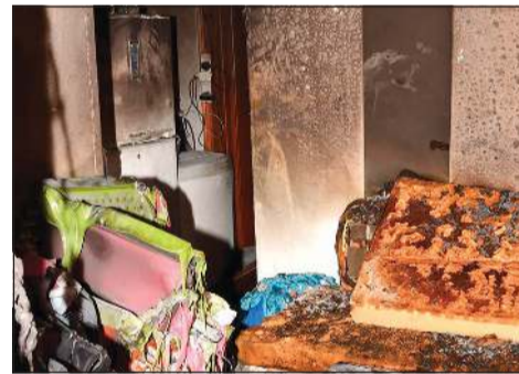
حريق الفروانية أتى على محتويات الشقة