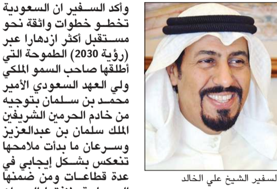
السفير الشيخ علي الخالد

جدة - (كونا): أشاد سفيرنا لدى السعودية الشيخ علي الخالد بالنجاح الذي حققته «قمة تعافي القطاع السياحي» في الرياض من الناحية التنظيمية والفعاليات المصاحبة، معرباً عن شكره لما لمسه من المنظمين والعاملين بالقمة. وقال السفير الشيخ علي الخالد في تصريح له (كونا) إنه «انعكست للعالم أجمع صورة مشرقة عن السعودية»، مشيراً إلى أن القمة التي عقدت يوم الأربعاء الماضي كانت فرصة للاستفادة على جميع الأصعدة خصوصاً توحيد الإجراءات الاحترازية للسفر والتعاون مع منظمة الصحة العالمية ومنظمة السياحة العالمية، وكانت جلساتها وفعاليتها محط اهتمام عالمي لعدد الخطيب وتوجيهاته الكريمة في إنجاح القمة في أعلى مستوى من حيث التنظيم والحضور، وعكس هذا التفوق مدى حرص واهتمام السعودية بالسياحة التي تعد إحدى ركائز التحول الوطني من خلال رؤية المملكة 2030، والتي يتمثل هدفها في المساهمة في بناء مجتمع حيوي واقتصاد مزدهر ووطن طموح.