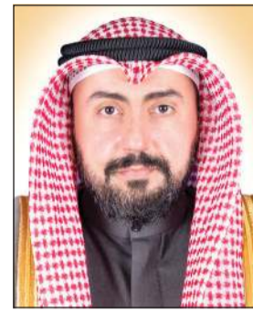
الشيخ د. ياسل الصباح

شارك في اجتماع استثنائي لوزراء الصحة بدول مجلس التعاون بالرياض