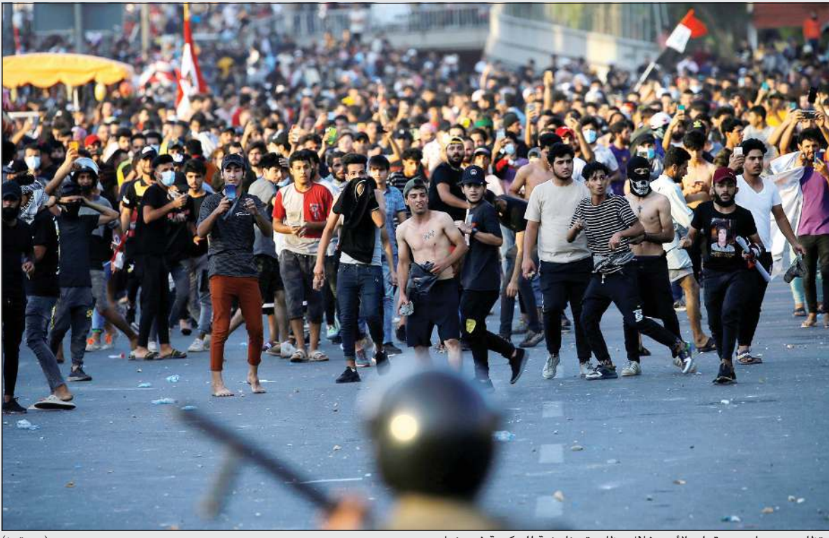
مظاهرون يواجهون قوات الأمن خلال مظاهرة مناهضة للحكومة في بغداد

وغالبا ما تنسب الاغتيالات التي استهدفت ناشطين منذ انطلاق «ثورة تشرين» في العام 2019، إلى فصائل مسلحة موالية لإيران. وقال المصدر إن الجهة المنفذة لعملية التوقيف هي لجنة مكافحة الفساد في وكالة الاستخبارات ومهمتها توقيف مسؤولين كبار متورطين في قضايا فساد. وتحدث المصدر الأمني عن وجود توتر تحسبا لتصعيد أو ردة فعل من قبل تلك الفصائل التي تحاول الضغط للإفراج عن مصلح. وأصدر الحشد الشعبي إثر التوقيف بيانا توعد فيه بأنه سيتم الإفراج عنه وستقوم الهيئة برده الجهات التي تحاول خلط الأوراق».