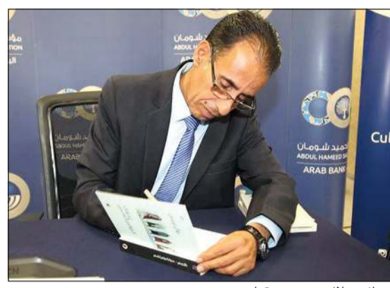
الروائي جلال برجس موقعا

رويتز: فازت رواية «دفاتر الوراق» للأردني جلال برجس أمس بالجائزة العالمية للرواية العربية في دورتها الرابعة عشرة والتي باتت من أرفع الجوائز الأدبية في مجال الإبداع الروائي. تتناول الرواية الصادرة عن المؤسسة العربية للدراسات والنشر قصة بائع الكتب والقارئ النهم إبراهيم الذي يقف متجره ويعد نفسه أسير حياة التشرد، وبعد إصابته بالفصام يستدعي أبطال الروايات التي كان يحبها ليخفي وراء اقتنعتهم وهو ينفذ سلسلة من عمليات السطو والسرقة والقتل. جاء الإعلان عن الجائزة