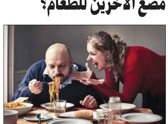
البعض لا يستطيع تحمل أصوات مضغ الطعام

و أوضح المتحدث باسم شرطة شمال سومطرة هادي