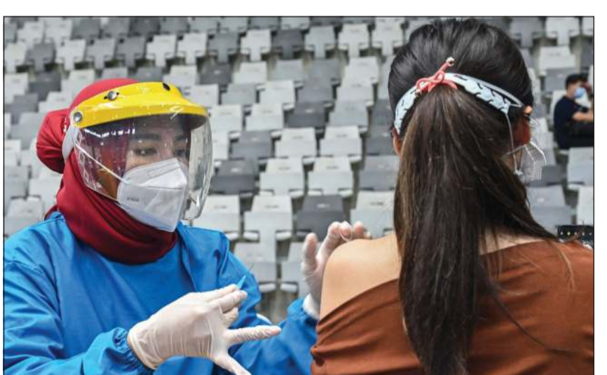
إندونيسيا تواصل تطعيم مواطنيها مجانا

أ.ف.ب: أعلنت السلطات الإندونيسية القبض على أربعة أشخاص بتهمة سرقة لقاحات مخصصة للسجناء وبيعها للعامة. وحصل المشتبه فيهم على أكثر من ألف جرعة من لقاح شركة «سينوفاك» الصيني مخصصة للسجناء، وعرضوها على مشترين في العاصمة جاكارتا وفي مدينة ميدان بشمال سومطرة مقابل حوالي 250 ألف روبية (17 دولارا) لكل منها. وقالت الشرطة إن الموقوفين الأربعة بينهم طبيب في سجن ومسؤول صحي محلي، قد يواجهون عقوبة السجن مدى الحياة إذا أدبوا بموجب قانون مكافحة الفساد في إندونيسيا.