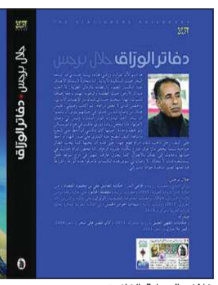
غلاف الرواية الفائزة

بأن الوصول إلى الصخرة العميقة للألم، هو الشرط الإلزامي لاختراع الأحلام، وللنهوض بالأمل فوق أرض أكثر صلابة.. وكانت الجائزة قد استقبلت هذه الدورة 121 رواية من 13 دولة اختيرت منها ست روايات للقائمة القصيرة في مارس. وحصل كل مرشح بالقائمة القصيرة على جائزة مالية قدرها 10 آلاف دولار فيما يحصل الفائز بالجائزة على 50 ألف دولار إضافية. يرعى الجائزة مركز أبوظبي للغة العربية التابع لدائرة الثقافة والسياحة في أبوظبي بينما تحظى الجائزة بدعم من مؤسسة جائزة بوكر في لندن.