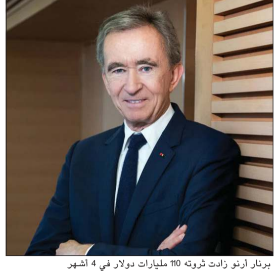
برنار أرنو.. أغنى رجل في العالم

أ.ف.ب: اختار ثنائي هندي عقد قرانهما بين الغيوم خلال رحلة جوية تابعة لشركة طيران محلية بحضور 161 مدعوا، في انتهاك للقيود المفروضة لمكافحة كوفيد-19، على ما أفادت الصحاف الهندي. وأمرت هيئة الطيران المدني في الهند بإجراء تحقيق وجددت عمل طاقم الطائرة، وفق مصادر رسمية.