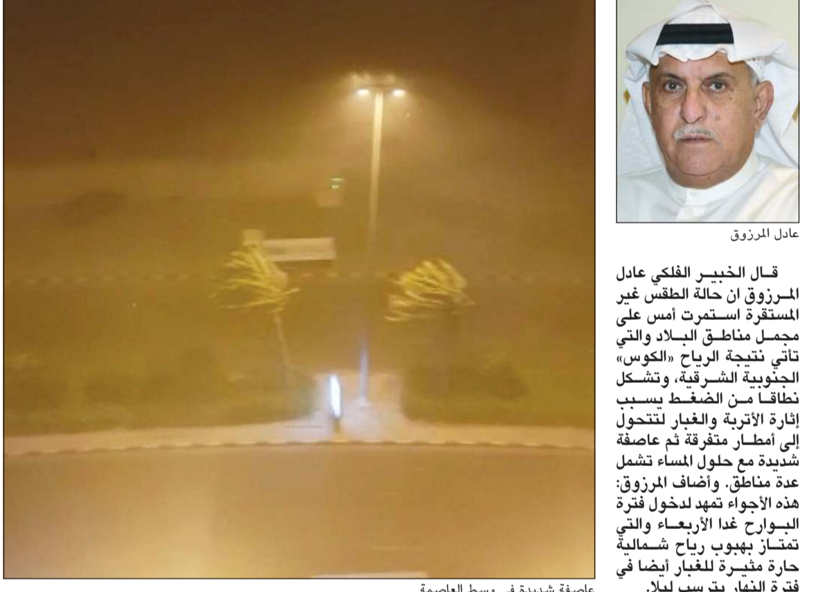
عاصفة شديدة في وسط العاصمة