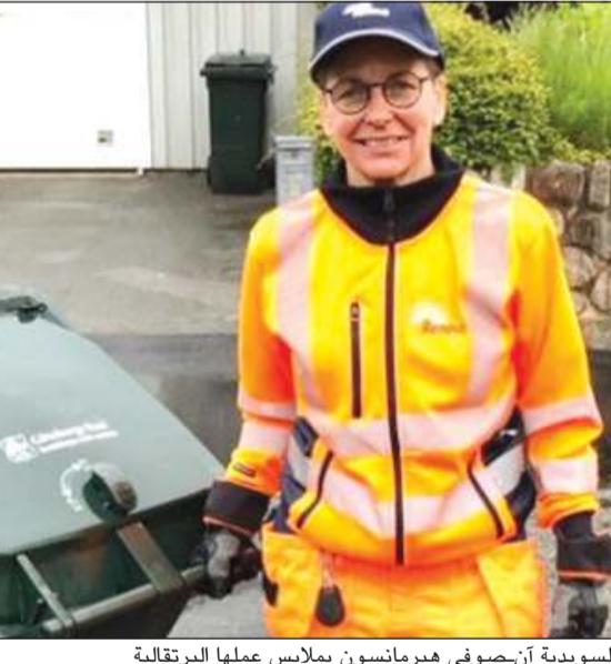
السويدية آن-صوفي هيرمانسون بملابس عملها البرتقالية

القمامة في شاحنتها. هل يعني هذا انها لفظت العمل السياسي نهائياً؟ تقول هيرمانسون ان العودة إلى العمل السياسي ليست مستبعدة وهي على أي حال ليست بعيدة في عملها الجديد عن عالم السياسة، لأن السكان الذين تصادفهم في عملها ويتعرفون عليها كثيراً ما يستوقفونها للخوض في نقاشات سياسية وهي لا تمانع في ذلك. تقر هيرمانسون بأن عملها الذي بدأت عام 2018 مرهق ولكنها تجد متعة فيه، فضلاً عن انها ارتاحت من ساعات الدوام المحددة والاجتماعات الطويلة والرئتين المتواصل لهايتها. أضف إلى ذلك المديح الذي ينهال عليها لقرارها الجريء.