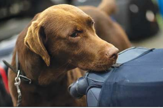
استخدام الكلاب في المطارات يمكن أن يكشف 91٪ من الحالات

عدم وجود المركب الكيميائي فيها. وبشكل عام تمكنت الكلاب من التعرف على 94 إلى 82٪ من عينات سارس-كوف-2. ثم قام الباحثون بمنجدة مدى فعالية معدلات النجاح هذه، جنباً إلى جنب مع اختبارات كوفيد التلقيدية عبر تفاعل البوليميراز المتسلسل (بي سي آر)، في الكشف عن حالات كوفيد-19 الخفيفة أو غير المصحوبة بأعراض، ووجدوا أن استخدام الكلاب لفحص الواصلين إلى المطارات على سبيل المثال يمكن أن يكشف 91٪ من الحالات، مما يؤدي إلى معدل انتقال أقل بمقدار 2,24 مرة مقارنة باختبارات تفاعل البوليميراز المتسلسل وحدها.