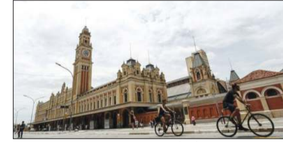
متحف اللغة البرتغالي أحد أبرز إنجازات باولو منديس دا روشا

أ.ف.ب: توفي المهندس المعماري البرازيلي باولو منديس دا روشا الحائز سنة 2006 جائزة بريتزكر التي توصف بـ«نوبل الهندسة المعمارية»، في ساو باولو عن 92 عاماً، على ما أعلنت عائلته. ولم يكشف عن سبب وفاة دا روشا الذي وصفه مجلس الهندسة المعمارية والتخطيط الحضري البرازيلي بأنه مهندس «متفرد جريء». وكان دا روشا، المولود في ولاية أسبيريتو سانتو جنوب شرق البرازيل سنة 1928، قد بدأ مسيرته سنة 1955 لكن شهرته العالمية أتت في مرحلة متأخرة اعتباراً من العقد الأول من القرن الحالي. وقد صنع أهم مشاريعه في مدينة ساو باولو، أكبر مدن أميركا اللاتينية، خصوصاً تجديد مبنى البينكوتيك ومتحف اللغة البرتغالية.