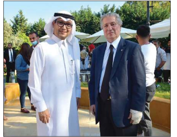
رئيس الجمهورية الأسبق أمين الجميل مع السفير وليد بخاري في داره

■ إخبار أمام النيابة ضد الوزير المسيء بثمة إثارة النعرات والقذح والذم.. والنائبه الطبش: لتبدأ المحاسبة من بعدا