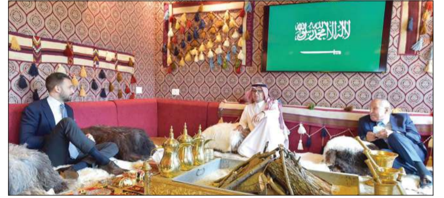
رئيس اللقاء الديمقراطي النائب تيمور جنبلاط متحدثاً إلى السفير البخاري