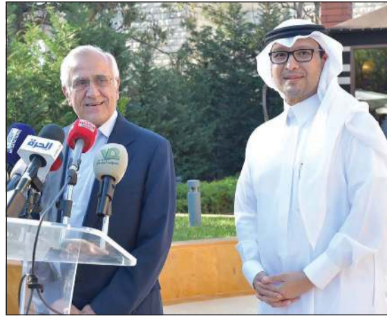
رئيس الجمهورية السابق ميشال سليمان متحدثاً خلال زيارته داره السفير السعودي