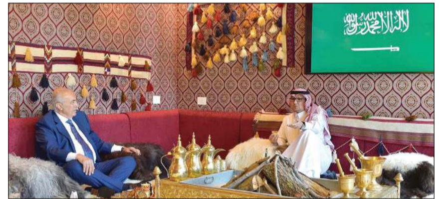
النائب فؤاد مخزومي في زيارة تضامنية