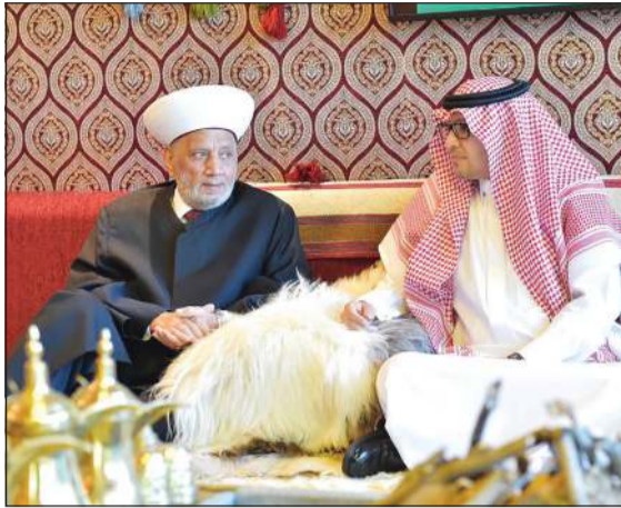
المفتي عبداللطيف دريان خلال زيارة تضامنية إلى داره السفير السعودي