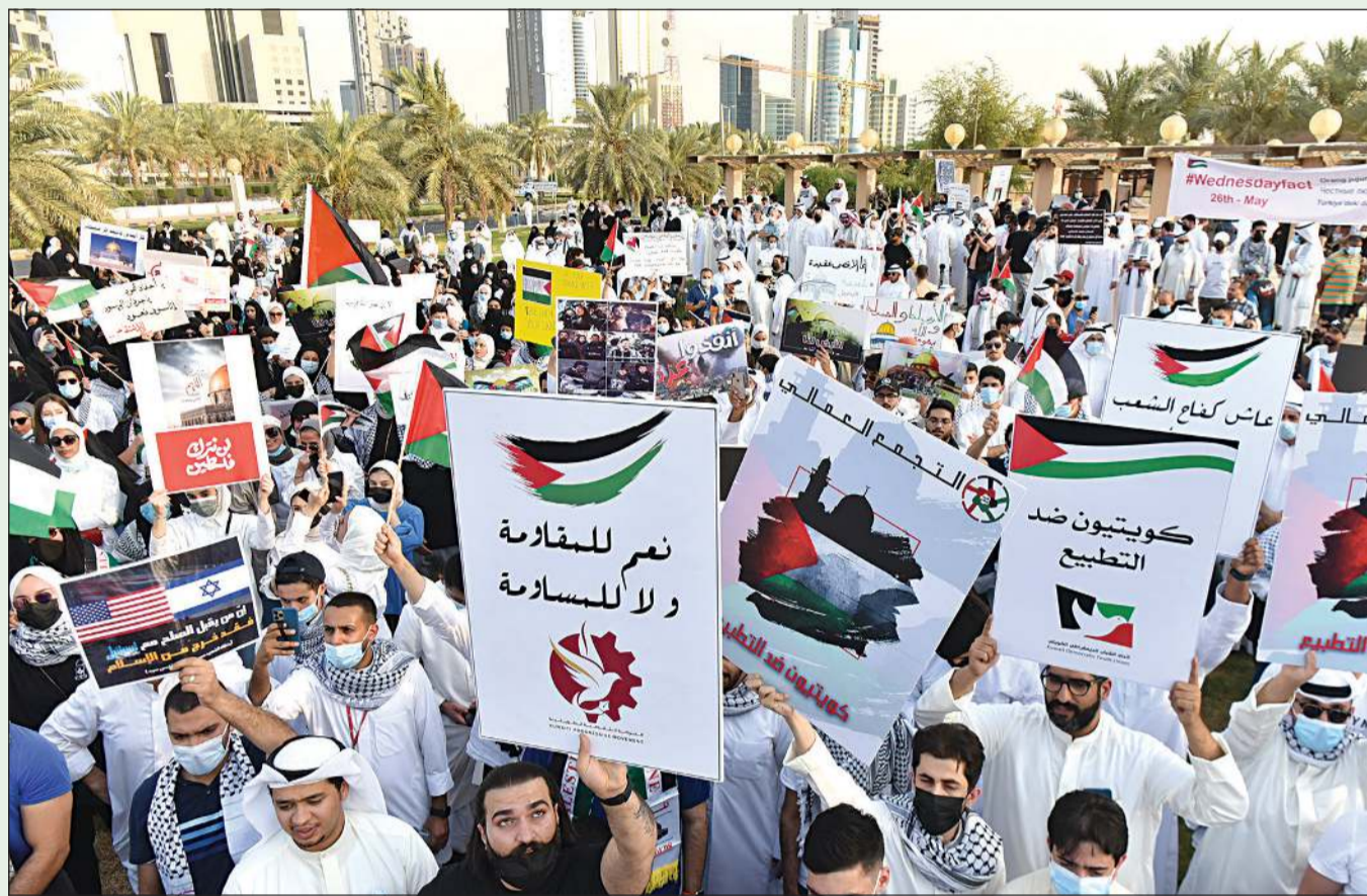
حشود ترفع لافتات التضامن مع القضية الفلسطينية ومعارضة التطبيع مع الكيان الصهيوني في ساحة الإرادة أمس

فرزة كويتية لدعم القضية الفلسطينية: قاوم.. و«كلا كلا للتطبيع» «الشؤون» و«الخارجية» أطلقت حملة لجمع التبرعات بمشاركة خيرية 05