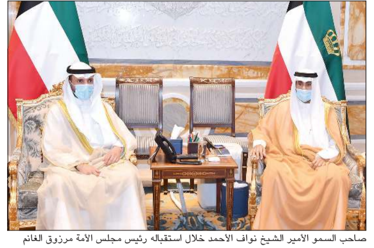
صاحب السمو الأمير الشيخ نواف الأحمد خلال استقباله رئيس مجلس الأمة مرزوق الغانم