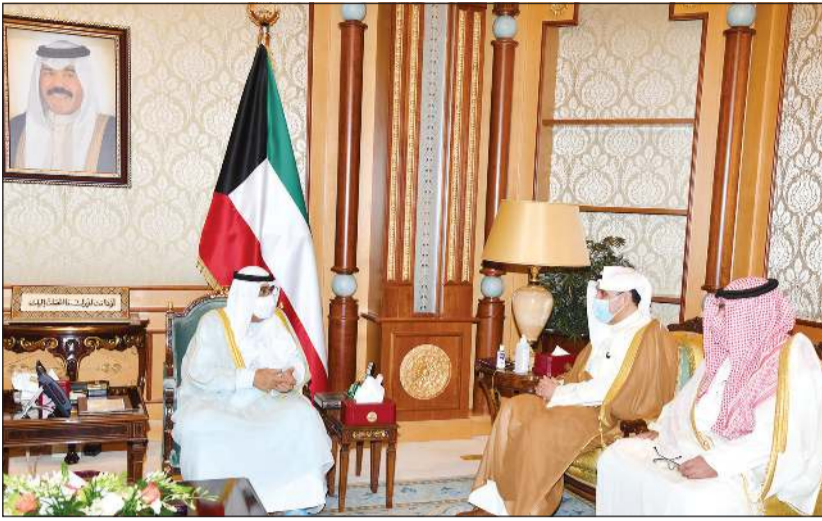
سمو ولي العهد الشيخ مشعل الأحمد خلال استقباله الشيخ حمد جابر العلي والشيخ ثامر العلي

استقبل سمو ولي العهد الشيخ مشعل الأحمد بقصر بيان صباح امس رئيس مجلس الأمة مرزوق الغانم. كما استقبل سمو ولي العهد سمو رئيس مجلس الوزراء الشيخ صباح الخالد. واستقبل سمو ولي العهد نائب رئيس مجلس الوزراء ووزير الدفاع الشيخ حمد جابر العلي، ووزير الداخلية الشيخ ثامر العلي. وقدم الشيخ حمد جابر العلي لسموه الشيخ عبدالله علي عبدالله بمناسبة تعيينه رئيسا للإدارة العامة للطيران المدني. واستقبل سمو ولي العهد نائب رئيس مجلس الوزراء ووزير العدل ووزير الدولة لشؤون تعزيز النزاهة عبدالله الرومي.