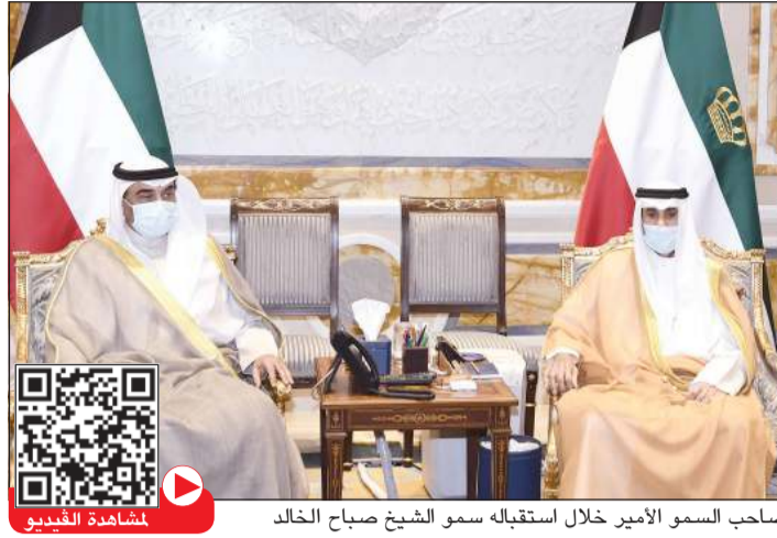
صاحب السمو الأمير خلال استقباله سمو الشيخ صباح الخالد

أعلنت إدارة العلاقات العامة في البلدية عن قيام الفريق الرقابي بطوارئ فرع بلدية محافظة مبارك الكبير بتنفيذ جولات ميدانية على المجمعات التجارية والمحلات والأسواق المركزية في منطقة صباح السالم، وصبحان والشريط الساحلي وأسواق القرين، للتأكد من التزام المحلات بلوائح وأنظمة البلدية وتطبيق القرار الإداري 1766 /2021 والتأكد من التزام العاملين باتخاذ الإجراءات والتدابير الوقائية والاحترازية بارتداء القفازات والكمامات والتباعد الجسدي لتجنب انتشار فيروس كورونا. وفي هذا السياق، أكد رئيس فريق الطوارئ بفرع بلدية محافظة مبارك الكبير ناصر الهاجري أن جولات الرقابي التي نفذها المفتشون بالفريق الرقابي أسفرت عن الكشف على 62 محلاً و16 مجمعاً تجارياً وتحرير مخالفة فرز نفايات في 3 إنذارات لتجنب مخالفة