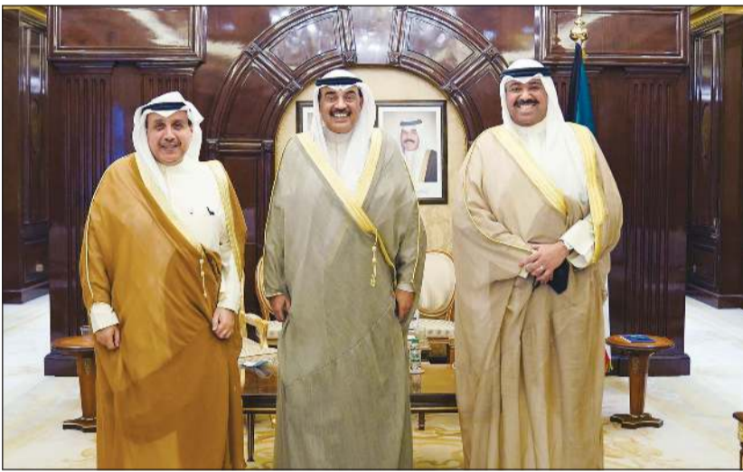
سمو الشيخ صباح الخالد خلال استقباله الشيخ حمد جابر العلي والشيخ عبدالله العلي

استقبل سمو الشيخ صباح الخالد رئيس مجلس الوزراء في قصر بيان اليوم امس نائب رئيس مجلس الوزراء ووزير الدفاع الشيخ حمد جابر العلي، حيث قدم لسموه رئيس الإدارة العامة للطيران المدني الشيخ عبدالله علي عبدالله وذلك بمناسبة تعيينه في منصبه الجديد.