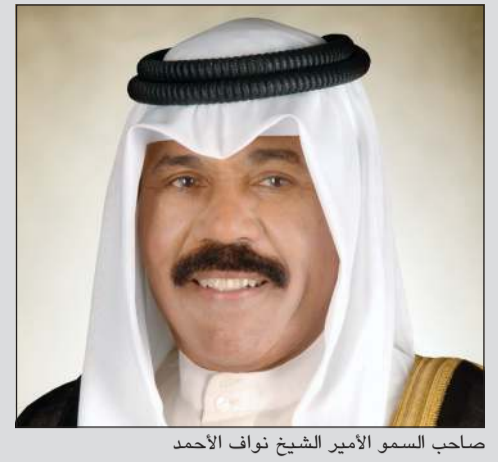
صاحب السمو الأمير الشيخ نواف الأحمد

صاحب السمو هنا المواطنين والمقيمين بعيد الفطر: لينعم الجميع بالمحبة والهناء 03