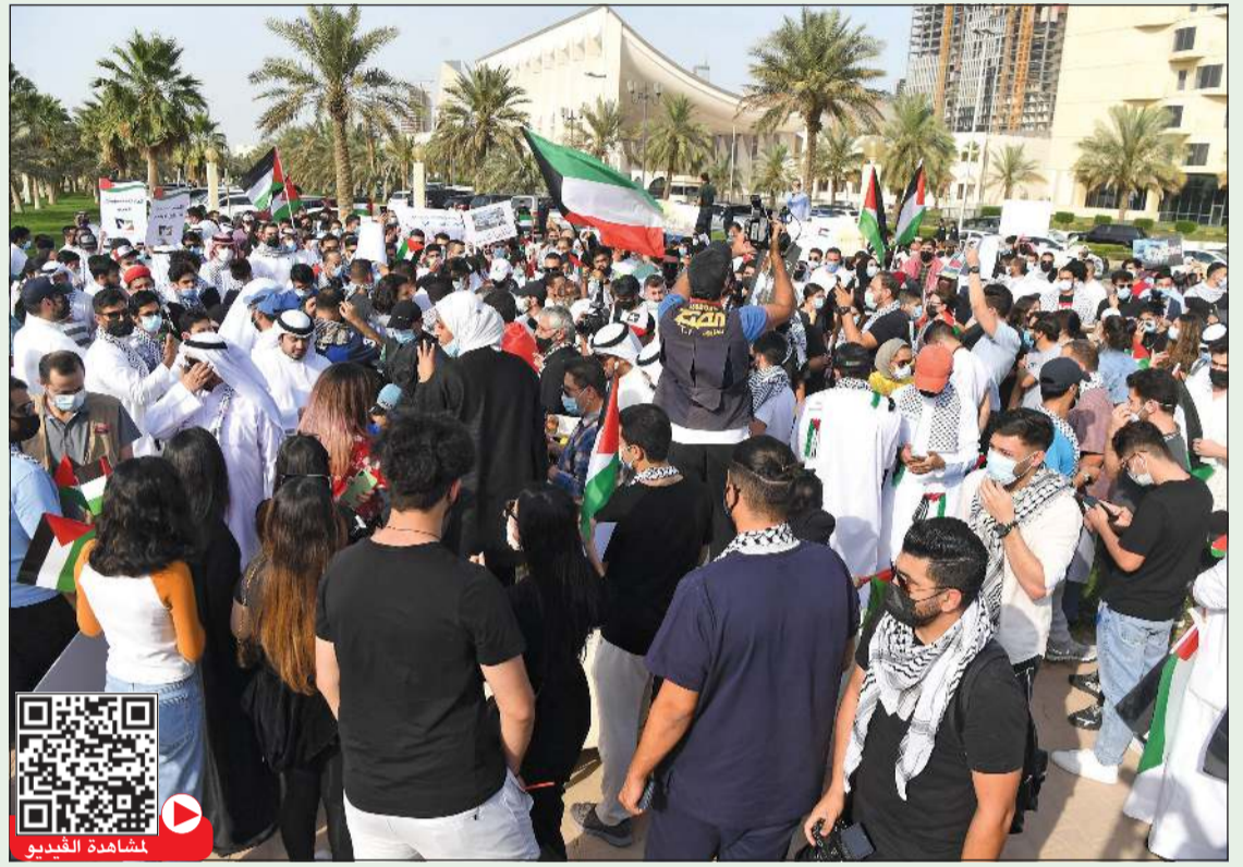
وقفه كويتية في ساحة الإرادة للتضامن مع القدس وفلسطين والتنديد بجرائم الاحتلال الصهيوني (محمد هاشم)