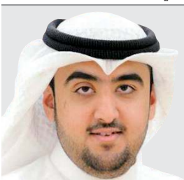
الشيخ محمد أحمد الفالح الصباح