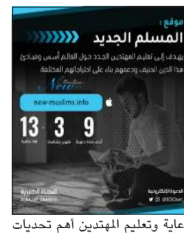
رعاية وتعليم المهنيين أهم تحديات اللجنة

وأختتم الدوسري تصريحه مبيناً أن مشروع تعليم المهنيين الجدد بحاجة ماسة إلى الدعم والتبرع حتى يكمل مسيرة العلم والتعليم ولذلك أدعو كل أصحاب الأيدي البيضاء والمحسنين إلى دعم هذا المشروع عظيم الأثر من خلال زيارة رابط المشروع بموقع اللجنة www.donate.edc.org.kw عن طريق الاتصال على الخط الساخن للجنة 9728804 أو مركز الاتصال 1.