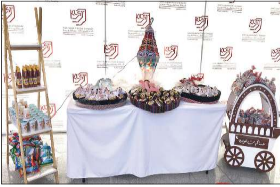
من الاحتفاء بمناسبة القريعتان