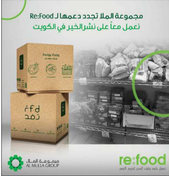
تعاون بين مجموعة الملا و«ريفود» لنشر أعمال الخير في الكويت

في إطار التزامها المستمر نحو مسؤوليتها المجتمعية، أعلنت مجموعة الملا - مجموعة الأعمال الرائدة ذات الاختصاصات المتنوعة في القطاع الخاص ومقرها الكويت، ويعمل لديها أكثر من 15000 موظف - عن تجديد دعمها لمؤسسة «ريفود» غير الهادفة للربح.