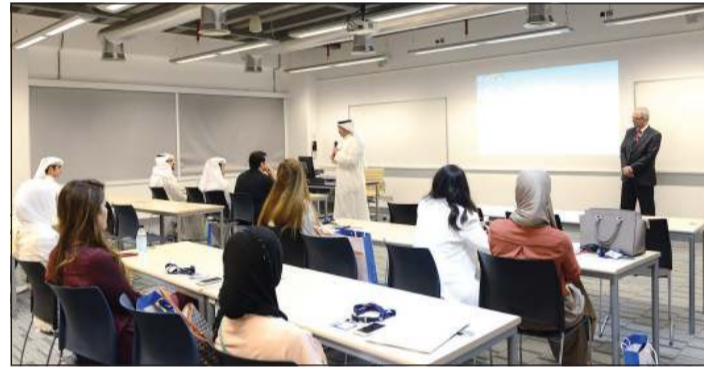
جانب من محاضرات تخصص ماجستير إدارة الأعمال