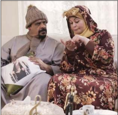
«عز الدين غريب» داود حسين مع أم كلثوم المصري وعبير الجندي