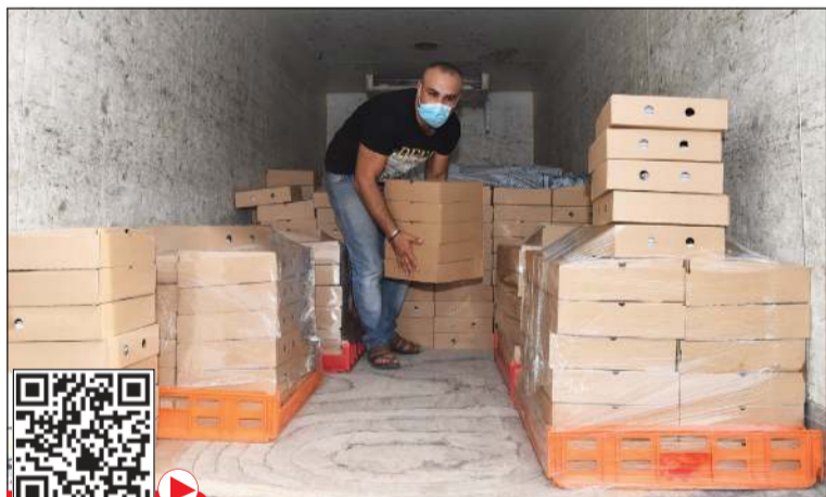
رغم المتاعب إلا أن العمل التطوعي له متعة كبيرة