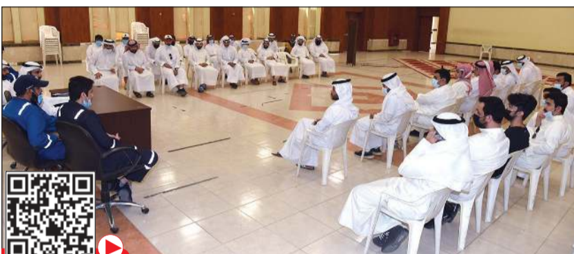
جانب من ندوة اتحاد عمال البترول (أحمد علي)