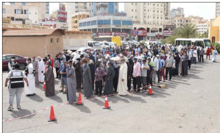
المتطوعون يحرصون على تنظيم عملية التوزيع والالتزام بالإجراءات الاحترازية