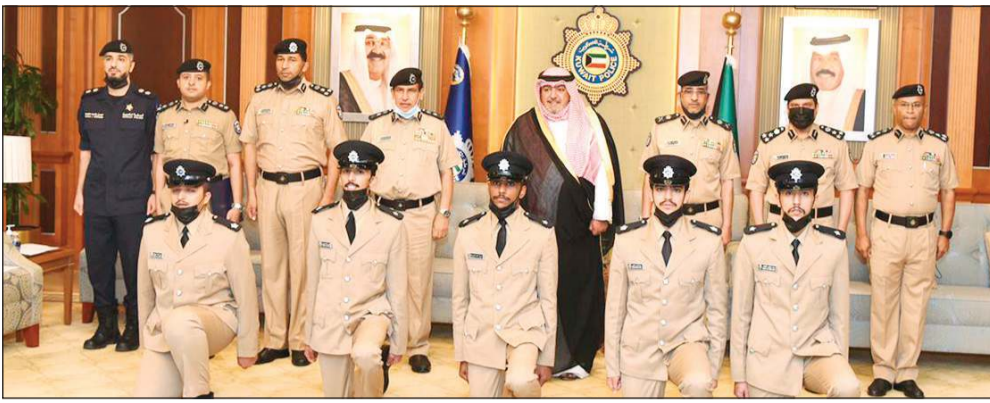
الشيخ ثامر العلي والفريق عصام النهام وقيادات الأكاديمية يتوسطون الخريجين

استقبل وزير الداخلية الشيخ ثامر العلي في مكتبه بمقر وزارة الداخلية أمس الأول بحضور وكيل وزارة الداخلية الفريق عقاب العبدالله للعلوم الأمنية اللواء ناصر بورسلي 5 ضباط برتبة ملازم من الدفعة 46، وذلك لأداء القسم أمام الوزير بسبب تخلفهم عن زملائهم لإصابتهم بفيروس كورونا. وقدم وزير الداخلية التهنئة إلى الخريجين بمناسبة تخرجهم والانضمام إلى زملائهم في ميدان العمل، كما وجه الوزير العلي الخريجين بتطبيق