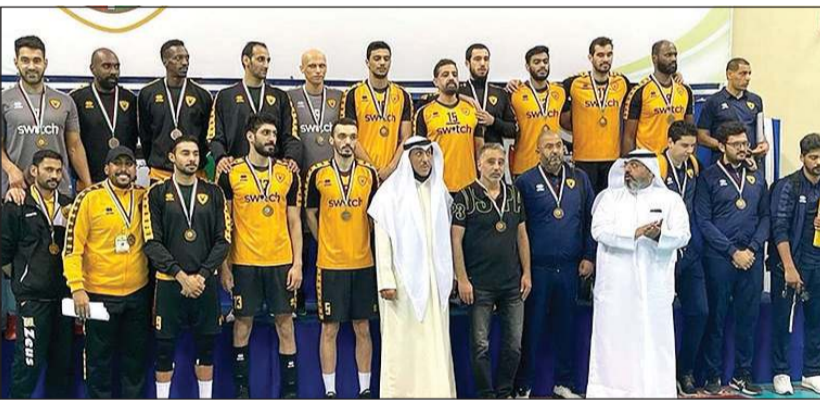
جانب من تتويج القادسية