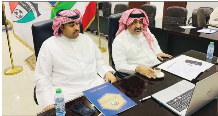
الشيخ أحمد يوسف وصالح القناعي خلال المشاركة في الاجتماع

أصدرت العمومية لاتحاد كأس الخليج العربي قرارا بإقامة «خليجي 25» في مدينة البصرة العراقية بالإجماع وذلك خلال الاجتماع الاستثنائي الذي عقده مساء أول من أمس برئاسة الشيخ حمد بن خليفة بن أحمد آل ثاني رئيس اتحاد كأس الخليج لكرة القدم «عبر تقنية الفيديو»، وبحضور كل من رئيس اتحاد الكرة الشيخ أحمد يوسف، ورئيس الاتحاد الإماراتي راشد بن حميد النعيمي، ورئيس الاتحاد البحريني الشيخ علي بن خليفة آل خليفة، ورئيس اتحاد السعودية ياسر بن حسن المسحل، ورئيس