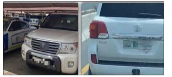
المركبة التي أخفيت لوحتها قبل وبعد الضبط