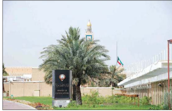
مبنى وزارة الخارجية

صدر مرسوم بعدد من الترقيات في وزارة الخارجية، حيث تم بموجبه ترقية 45 وزيراً مفوضاً إلى درجة سفير و30 مستشاراً إلى درجة وزير مفوض. وجاء في المادة الأولى من المرسوم: يُرقى كل من التالية أسماؤهم من درجة وزير مفوض إلى درجة سفير بوزارة الخارجية: