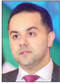
د. عبد الله السندي

أعلن المتحدث الرسمي لوزارة الصحة د.عبدالله السندي تسجيل 1286 إصابة جديدة بـ «كورونا» في الكويت (كوفيد - 19) في الساعات الـ 24 الماضية، ليرتفع بذلك إجمالي عدد الحالات المسجلة في البلاد إلى 268,235، فيما سجلت 11 حالة وفاة ليصبح مجموع حالات الوفاة المسجلة 1,527. وأضاف د.السندي لـ «كونا»، أنه تم أيضاً تسجيل 1437 حالة شفاء ليرتفع بذلك إجمالي عدد المتعافين إلى 251,511 حالة مبنياً أن نسبة مجموع حالات الشفاء من مجموع الإصابات بلغت 93.77%.