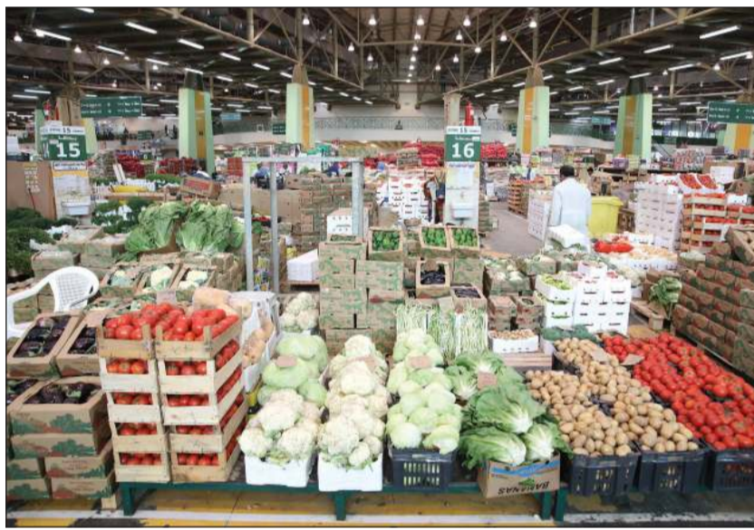
جانب من المنتجات الزراعية الكويتية

وأعرب عن شكره لوزير الشؤون الاجتماعية، على تفاعله مع مقترح الاتحاد ومطالب الجمعيات التعاونية. وأفاد الكشطي بأن الاتحاد قدم لوزير الشؤون مقترح تعديل قرار 2020/45 بشأن دعم وترويج المنتجات