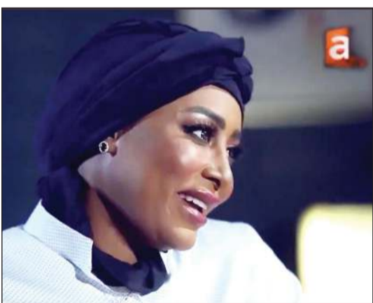
الإعلامية إيمان نجم