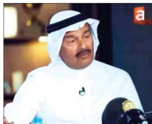
الفنان عبدالرحمن العقل