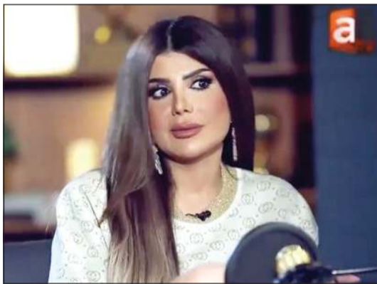
الفنانة إلهام الفضالة