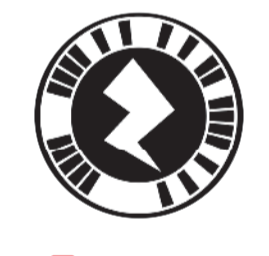
حمل تطبيق Zappar

والتأكد من عدم تكرار الأخطاء السابقة، مطالبا وزير التعليم العالي «إعادة هيكلة معهد الأبحاث واختيار دماء شبابية جديدة». وأضاف: «لا يعقل أن الوزير السابق بإصداره على إشرف القطاع النقطي على المرحتين الثانية والثالثة من المشروع يجب ألا تتكرر، مشيراً إلى أن المشروع يشكل قيمة مضافة ليس من ناحية الفوائد البيئية فقط بل من خلال توفير 6 ملايين برميل يوميا بمليارات الدنانير التي يمكن أن يستفيد منها البلد في ظل الأزمة المالية. وشدد على أهمية المتابعة البرلمانية لهذا المشروع