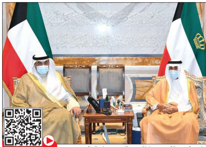
صاحب السمو الأمير مستقبلاً سمو الشيخ صباح الخالد

استقبل سمو ولي العهد الشيخ مشعل الأحمد بقصر بيان صباح أمس رئيس مجلس الأمة مرزوق الغانم. كما استقبل سمو ولي العهد سمو الشيخ صباح الخالد رئيس مجلس الوزراء. واستقبل سمو ولي العهد نائب رئيس مجلس الوزراء وزير الدفاع الشيخ حمد