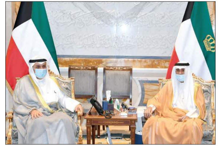
صاحب السمو الأمير مستقبلاً وزير الدفاع الشيخ حمد جابر العلي

زيمبابوي الصديقة ضمنها سموه خالص تهانيه بمناسبة العيد الوطني لبلاده وراجيا سموه له دوام الصحة والعافية. وبعث سمو ولي العهد الشيخ مشعل الأحمد ببرقية تهنئة إلى الرئيس إيرسون منانغاغوا رئيس جمهورية زيمبابوي الصديقة عبر فيها سموه عن خالص تهانيه بمناسبة العيد