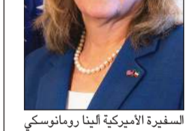
السفيرة الأميركية أيلنا رومانوسكي

كشفت السفيرة الأميركية لدى البلاد أيلنا رومانوسكي أنه يمكن الآن للمواطنين الكويتيين والمقيمين التقدم بطلبات تجديد تأشيرة الولايات المتحدة دون مقابلة إذا كانت التأشيرة صالحة أو منتهية الصلاحية في آخر 48 شهراً. لمزيد من المعلومات قم بزيارة https://t.co/8AX9loGBA .