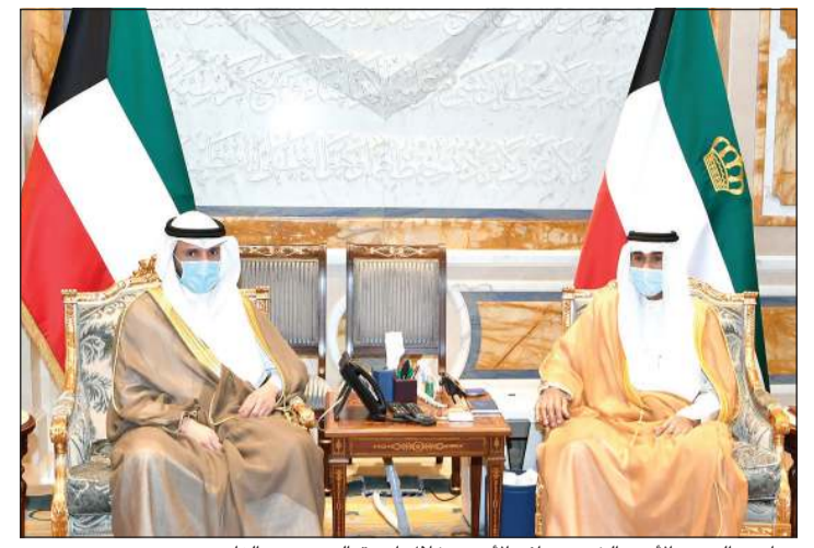
صاحب السمو الأمير الشيخ نواف الأحمد خلال استقباله مرزوق الغانم