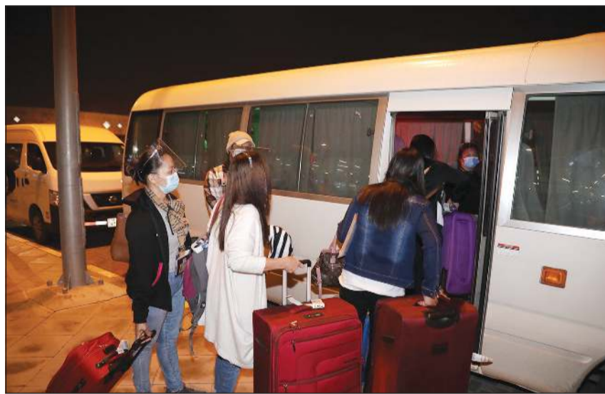
الفلبين أعلنت رفع الحظر عن ارسال عمالها المنزلية الى الكويت

أعلنت الفلبين رسمياً رفع الحظر عن إرسال العمالة المنزلية إلى الكويت.