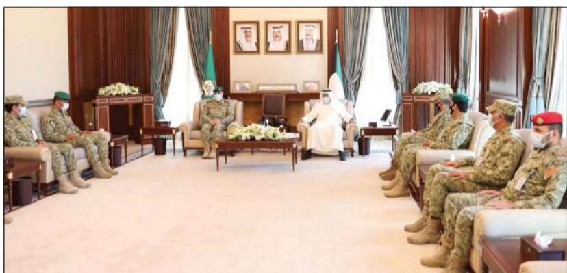
الفرق أول متقاعد الشيخ أحمد النواف خلال استقباله كبار القادة والضباط بالحرس الوطني

العالم بالخير والبركات، وأن يرفع البلاء والوباء ويحفظ الكويت من كل مكروه في ظل قيادتها الرشيدة، ممثلة بسيدي صاحب السمو الشيخ نواف الأحمد القائد للأعلى للقوات المسلحة وسمو ولي العهد الشيخ مشعل الأحمد.