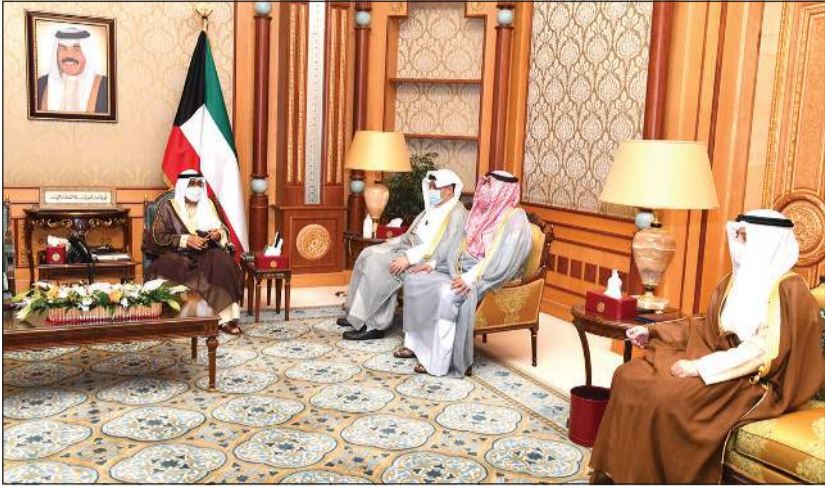
سمو ولي العهد الشيخ مشعل الأحمد خلال استقباله الشيخ حمد جابر العلي والشيخ ثامر العلي والشيخ د. أحمد ناصر المحمد ووزير الخارجية وزير الدولة

جابر العلي ووزير الخارجية وزير الدولة لشؤون مجلس الوزراء الشيخ د. أحمد ناصر المحمد ووزير الداخلية الشيخ ثامر العلي. كما استقبل سمو ولي العهد نائب رئيس مجلس الوزراء وزير العدل وزير الدولة لشؤون تعزيز النزاهة عبدالله الرومي.