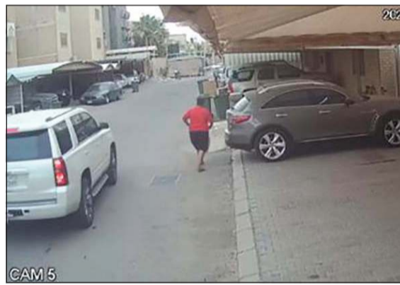
اللص السمين في طريقة لسرقة رباعية