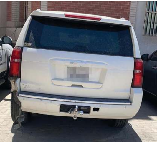
مركبات سرقتها الجنائي وأرشد عنها

الداخلية لفرض السيطرة الأمنية وضبط المطلوبين، تمكن رجال الأمن الجنائي من ضبط شخص بعد ساعات من ظهوره في مقطع فيديو وهو يقوم برصد المركبات الحديثة المتوقفة أمام المنازل وتشغيلها وسرقتها.