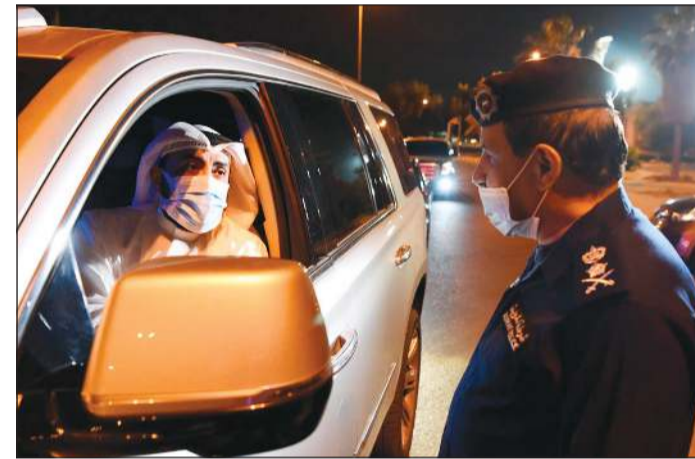
وزير الصحة يتبادل الحديث مع الفريق عصام النهام

واطلع اللواء الزعيبي على الجهود الأمنية للقطاع في تطبيق الحظر الجزئي مؤكداً على أن الجهد الكبير لرجال الأمن موضع تقدير من قبل القيادة السياسية. وشدد اللواء الزعيبي على حتمية تطبيق القانون فيما يتعلق بالحظر الجزئي مع مراعاة الحالات الإنسانية.