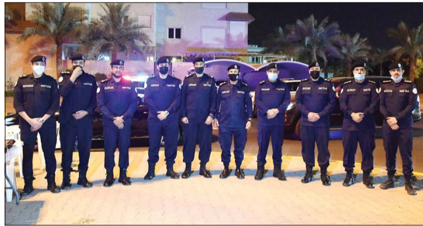
وكيل وزارة الداخلية متوسماً رجال نقطة أمنية بالروضة