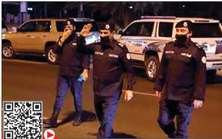
الواء فراج الزعيبي خلال تفقده نقاط حولي وإلى جواره اللواء عبدالله العلي