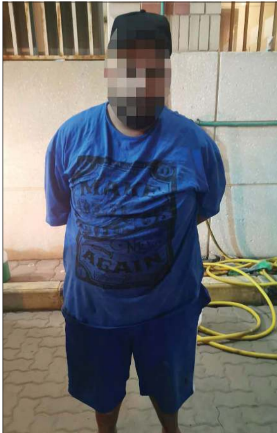
اللص السمين في قبضة «الجنائية»

الداخلية لفرض السيطرة الأمنية وضبط المطلوبين، تمكن رجال الأمن الجنائي من ضبط شخص بعد ساعات من ظهوره في مقطع فيديو وهو يقوم برصد المركبات الحديثة المتوقفة أمام المنازل وتشغيلها وسرقتها.