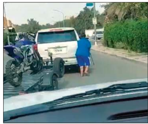
.. يسرق نارية