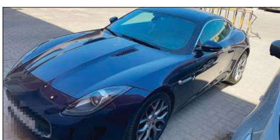
اللص يستهدف المركبات الفارهة

قال مصدر أمني أن اللص السمين يسرق المركبات الحديثة بطريقة ذكية إذ يتنقل بين داخل المناطق الراقية. وحينما يشاهد المرأتين الجانبيتين للمركبة ليستا مغلقتين يدرك ان مفتاحها في داخلها، إذ ان المركبات الحديثة وبمجرد إكحام إغلاقها بالريموت تغلق المرأتين، وبالتالي حينما يشاهد المرأتين مفتوحتين يقوم بفتح بابها ومن ثم يقوم بسرقتها.